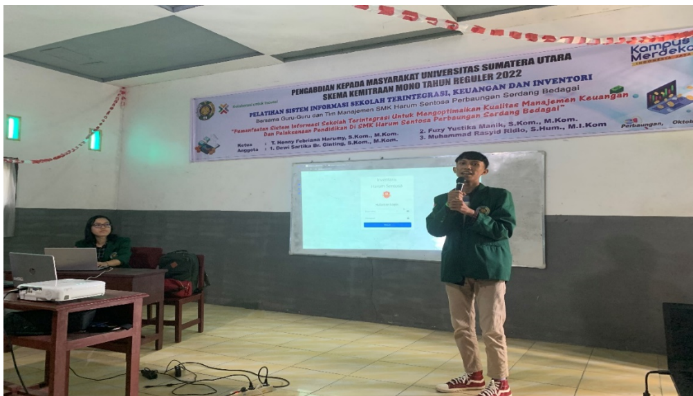
Gambar 4. Pelaksanaan Pengabdian

Dalam pelaksanaan kegiatan pengabdian ini dilakukan pre-test dan post-test dengan tujuan untuk mengevaluasi pemahaman peserta sebelum dan sesudah mendapatkan pelatihan dan dari tim pengabdian. Berikut hasil evaluasi pre-test dan post-test yang dilakukan sebagai berikut : Pretest dan Posttest dilakukan dengan memberikan kuisioner berisi sekitar 13 pertanyaan terhadap 22 Orang peserta dengan bobot 1= Kurang , 2 = Cukup, 3= Baik dan 4= Baik Sekali. Dimana untuk hasil pretest Rata Rata di bobot 1 dan 2 sedangkan hasil Pretest menunjukkan hasil yang meningkat yaitu di angka 3 dan 4 dimana memiliki arti 3= Baik dan 4= Baik Sekali