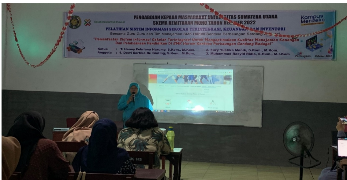
Gambar 2. Pemaparan Kepala Sekolah SMK Harum Sentosa

Realisasi pemecahan masalah yang dilakukan sejalan dengan upaya dan program tahunan dari mitra yaitu mengoptimalkan sistem informasi terintegrasi dan teknologi informasi untuk peningkatan pelayanan sekolah. Maka pada kegiatan pengabdian ini dilakukan dengan program pelatihan dan pendampingan penggunaan sistem informasi keuangan, Inventory dan Absensi berbasis Fingerprint. Kehadiran tim pengabdian disambut baik oleh kepala sekolah SMK Harum Sentosa beserta jajaran guru dan manajemen sekolah, dimana didalam kegiatan kepala sekolah mengutarakan program pelatihan yang dilakukan tim pengabdian sangat mendukung program yang sedang menjadi optimalisasi peningkatan kualitas dan pelayanan sekolah berbasis teknologi informasi.