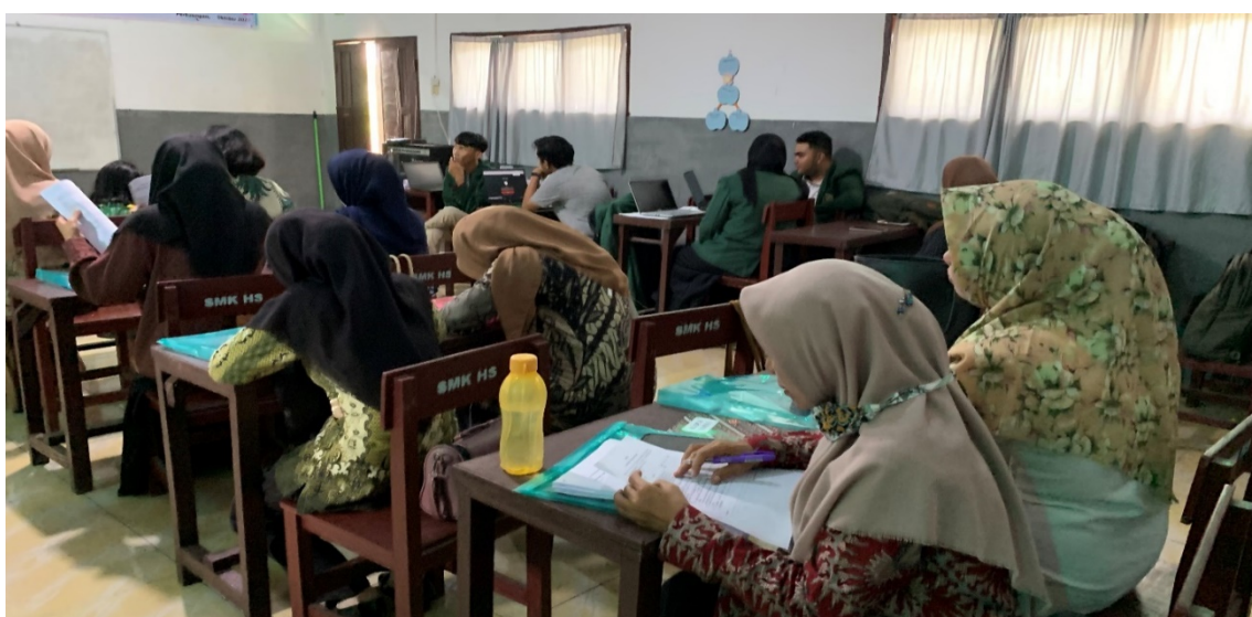
Gambar 3. Pengerjaan Pretest dan Posttest