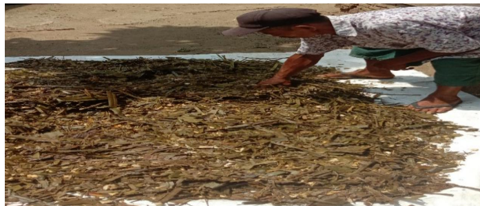
Gambar 5. Daun dan Pelepah Sawit Hasil Teknologi Amfoter

Limbah perkebunan berupa daun dan pelepah sawit yang telah ditambah urea dan difermentasi selama 14 hari atau pakan amfoter diamati kualitasnya dengan metode subjektif yaitu bentuknya masih utuh, berwarna hijau pada saat plastic dibuka setelah dikering anginkan selama 1 sampai 2 jam maka warnanya berubah menjadi coklat kekuningan serta memiliki aroma tape dan amonia. Pakan amfoter yang dihasilkan dalam pelatihan ini dapat dilihat pada Gambar 5. berikut: