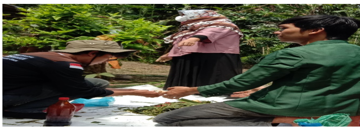
Gambar 2. Pelatihan pembuatan MOL