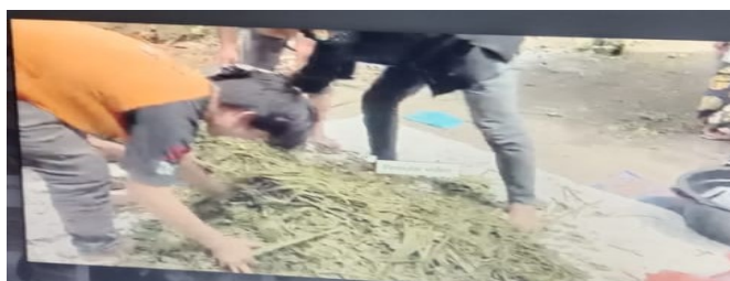
Gambar 3. Demo Pembuatan Pakan Amfoter

Proses pembuatan pakan amfoter terdiri dari: 1) molases sebanyak 1 kg dicampur dalam 10 liter air sumur/ air kelapa/ air cucian beras, 2) Urea sebanyak 4% atau 4 ons, 3) Daun dan pelepah sawit yang sudah dichooper sebanyak 10 kg, 3) Limbah buah atau sayur yang sudah dicacah sebanyak 1 kg, 4) MOL sebanyak 1% dan 5) Dedak sebanyak 1 kg. Molases, urea, MOL dan air dicampur rata dalam ember. Daun dan pelepah sawit yang sudah dichooper diratakan di atas terpal dengan ketinggian 5 cm kemudian dipercikkan dengan larutan molases, MOL dan urea secara merata. Setelah itu ditaburi lagi bagian atasnya dengan dedak secara merata kemudian pada bagian atasnya ditaburi dengan limbah sayur dan buah dengan ketebalan 5 cm kemudian dipercikkan kembali dengan larutan molases, MOL dan urea kembali begitu seterusnya sampai semua bahan yang akan dibuat amfoter habis. Setelah itu dilakukan pencampuran secara menyeluruh terhadap semua bahan yang sudah disusun tersebut, kemudian dimasukkan dalam drum dan ditutup rapat. Drum disimpan pada tempat yang teduh, terhindar dari matahari dan hujan. Pemeraman dilakukan selama 14 hari. Setelah 14 hari baru dibuka dan dikering anginkan selama 1-2 jam untuk menghilangkan gas hasil pemeraman, setelah itu baru diberikan kepada ternak. Dokumentasi tentang pelaksanaan pelatihan pembuatan pakan amfoter dapat dilihat pada Gambar 3. berikut: