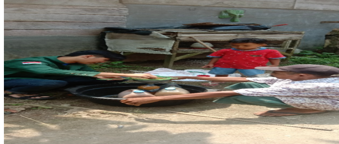
Gambar 4. Pemanenan MOL

mendegradasi atau merombak serat pada daun dan pelepah sawit menjadi senyawa yang lebih sederhana dan mudah diserap oleh tubuh ternak. MOL ini dapat digunakan dalam jangka waktu lama. Pemanenan MOL dilakukan tim pengabdian bersama Mitra. Dokumentasi pemanenan MOL dapat dilihat pada Gambar 4.