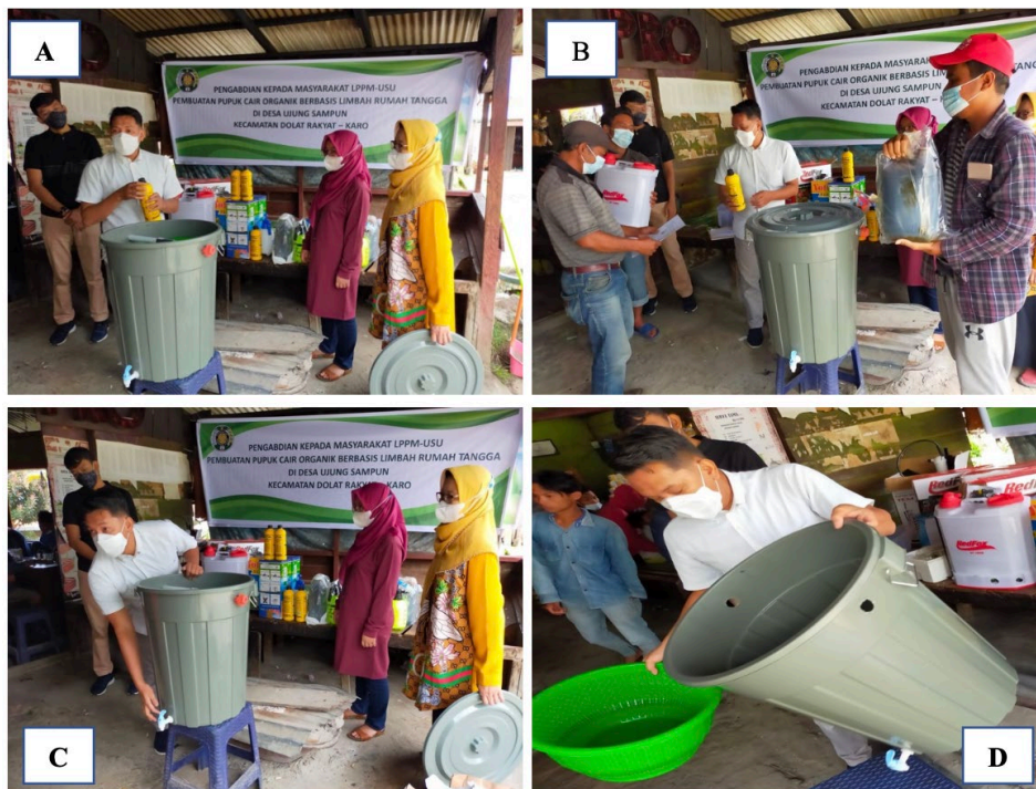
Gambar 4. Sosialisasi dan Pelatihan Pembuatan Komposter dan Pupuk Cair

Selama proses pelatihan pembuatan komposter partisipasi dari masyarakat di desa Ujung Sampun, Kab. Karo dalam mengikuti kegiatan ini juga sangat baik. Diskusi yang terjadi saat pelatihan terjalin secara 2 arah. Masyarakat aktif dalam memberikan pertanyaan terkait pembuatan komposter dan fungsi dari masing-masing bahan yang digunakan dalam pelatihan ini. Gambar 4 berikut ini adalah foto kegiatan selama pelaksanaan pengabdian kepada masyarakat. Pada gambar 4 bagian A dan B tim sedang menjelaskan tentang bakteri EM4 yang digunakan dalam proses fermentasi limbah organik. Pada EM4 terkandung banyak mikroorganismenya yang berperan dalam proses fermentasi tetapi hanya ada lima golongan pokok yang menjadi komponen utama, yaitu bakteri Lactobacillus sp, fotosintetik, Streptomyces sp, dan ragi [7]. Tim juga menjelaskan fungsi dari molase yang merupakan sumber nutrisi bagi mikroorganismenya yang terdapat dalam EM4. Beberapa penelitian menyebutkan bahwa molase juga dapat meningkatkan kandungan C-organik dan N-total pada pupuk kompos (pupuk padat) yang dihasilkan [8]. Pada gambar 4 bagian C dan D tim sedang menjelaskan bagian-bagian dari alat komposter dan fungsinya.