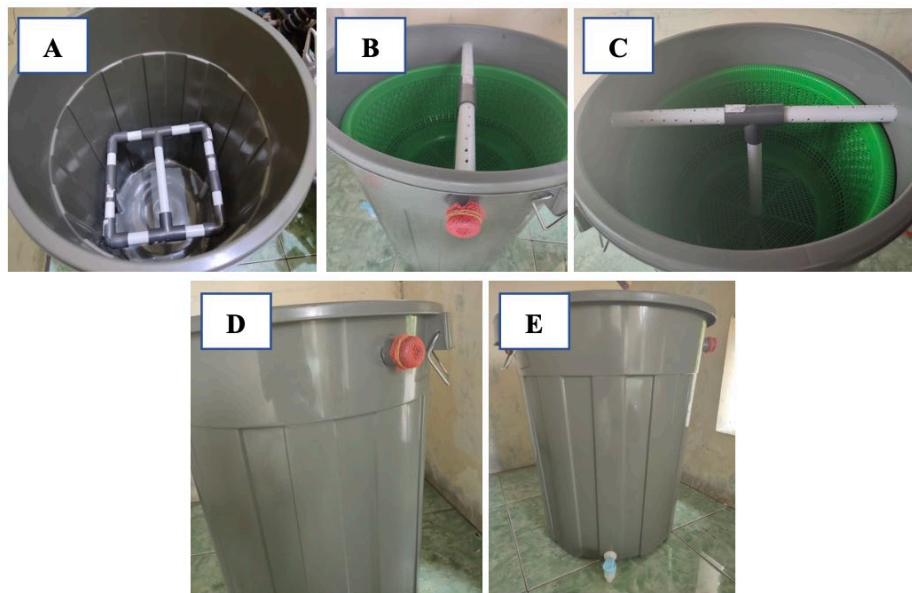
Gambar 3. Komposter untuk Menghasilkan Pupuk Cair Organik

Kegiatan pengabdian kepada masyarakat dengan judul Pelatihan Pembuatan Komposter Sederhana untuk Membuat Pupuk Cair Organik Berbasis Limbah Rumah Tangga telah terlaksana. Komposter yang dihasilkan dari kegiatan ini terlihat pada gambar 3 berikut.