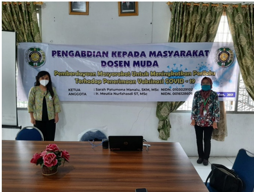
Gambar 1. Pelaksanaan Kegiatan Pengabdian Masyarakat

pengabdian menyediakan masker medis untuk dipakai oleh seluruh peserta selama kegiatan berlangsung. Sepanjang kegiatan pengabdian, peserta tidak diijinkan membuka masker. Selain itu juga peserta duduk dengan menjaga jarak dan menggunakan hand sanitizer yang telah disediakan.