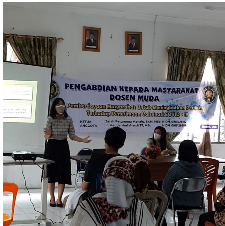
Gambar 2. Edukasi tentang Vaksinasi Covid-19