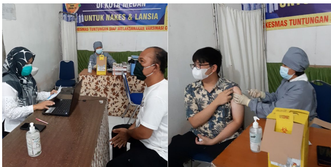
Gambar 3. Ajakan melakukan Vaksinasi Covid-19

Setelah selesai penyampaian edukasi oleh tim pengabdian, para peserta diajak untuk langsung melaksanakan vaksinasi di Puskesmas Medan Tuntungan. Para peserta bersedia karena telah yakin dan paham akan manfaat yang didapatkan setelah melaksanakan vaksinasi. Kegiatan vaksinasi didampingi oleh petugas puskesmas. Seluruh kegiatan vaksinasi berlangsung dengan lancar. Tim pengabdian berharap agar edukasi yang sudah disampaikan dapat diterapkan oleh seluruh peserta dan menghimbau agar tetap melaksanakan protokol kesehatan walaupun sudah divaksin.