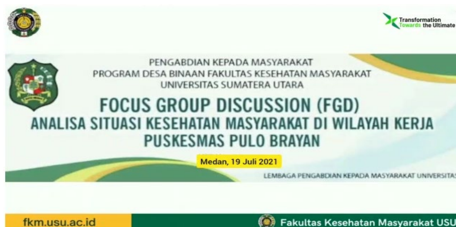
Gambar 2. FGD Analisis Situasi Kesehatan Masyarakat di Wilayah Kerja Puskesmas Pulo Brayan