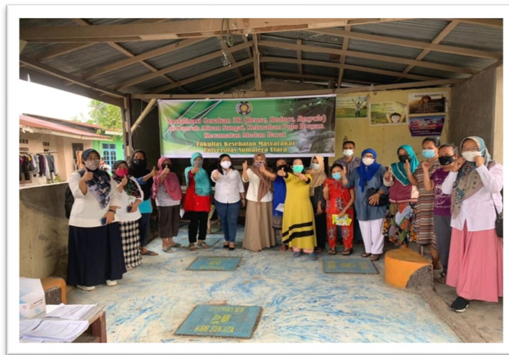
Gambar 12. Foto Bersama setelah Kegiatan Sosialisasi Gerakan 3R

benar dan gerakan 3R. Di akhir sosialisasi, masyarakat kemudian mengikuti posttest dengan pertanyaan yang sama dengan pretest. Dari hasil evaluasi pretest dan posttest, didapati bahwa terjadi perubahan pengetahuan, sikap, dan perilaku pada masyarakat tentang gerakan 3R. Setelah melakukan sosialisasi gerakan 3R, masyarakat juga dimotivasi untuk mengaplikasikan ilmu yang didapatkan dengan cara aktif mengikuti perlombaan daur ulang sampah. Masyarakat tampak antusias dengan kegiatan tersebut. Penilaian akan dilakukan oleh dosen yang kompeten di bidangnya, dengan poin utama penilaian, bahwa bahan utama pembuatan prakarya merupakan sampah yang bisa didaur ulang.