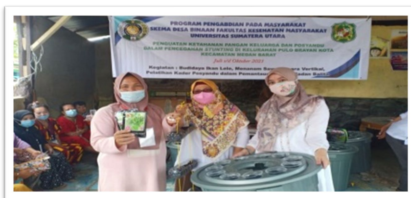
Gambar 7. Penyemaian Bibit Kangkung