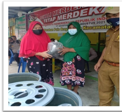
Gambar 8. Penyerahan Bibit Lele