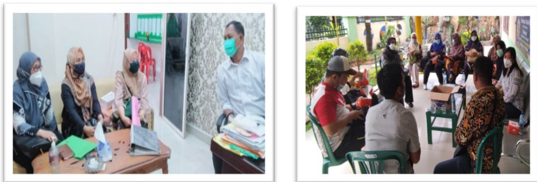
Gambar 4. Sosialisasi Rencana Kegiatan kepada Lurah Kelurahan Pulo Brayan Kota dan Kepala Lingkungan