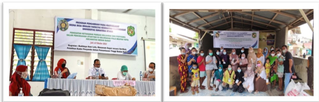
Gambar 6. Pelatihan Kader Posyandu dalam Pemantauan Tinggi Badan Balita dan Pelatihan Budidaya Lele dan Tanam Sayur Vertikal