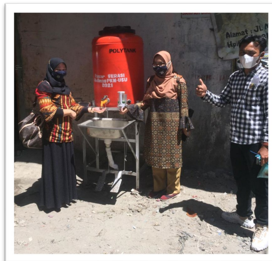
Gambar 11. Penyerahan Wastafel