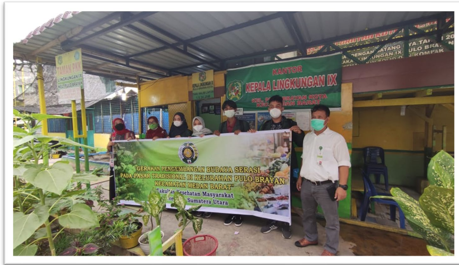
Gambar 10. Pembagian Masker