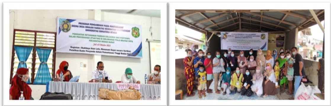
Gambar 6. Pelatihan Kader Posyandu dalam Pemantauan Tinggi Badan Balita dan Pelatihan Budidaya Lele dan Tanam Sayur Vertikal