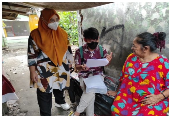
Gambar 13. Survei Pengumpulan Data