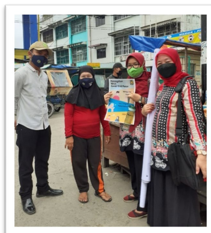
Gambar 9. Promosi Kesehatan