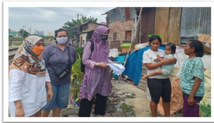
Gambar 5. Survei Awal Kondisi Stunting