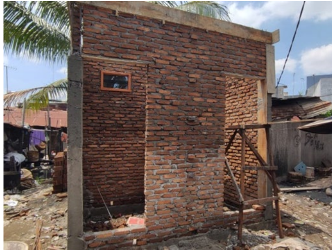
Gambar 17. Proses Pembangunan Jamban Sehat