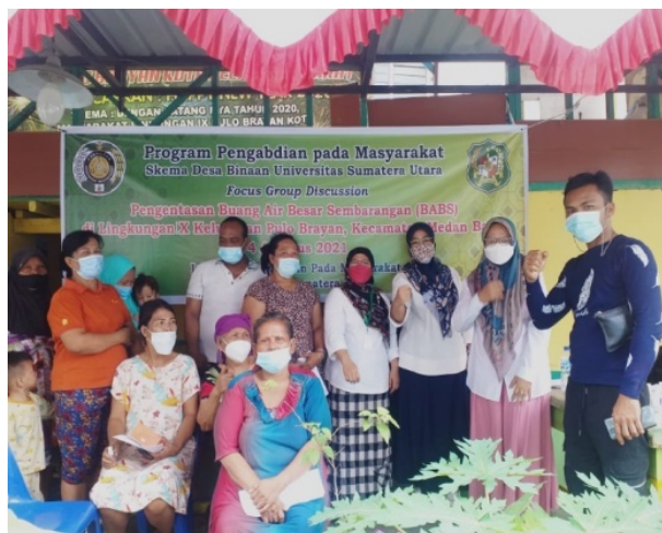
Gambar 15. FGD diseminasi hasil survei dan kesepakatan