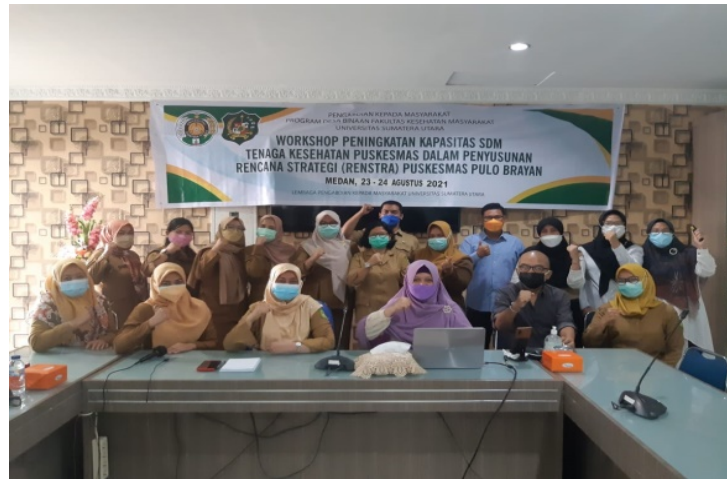
Gambar 3. Workshop Peningkatan Kapasitas SDM dalam Penyusunan RENSTRA Puskesmas Pulo Brayan