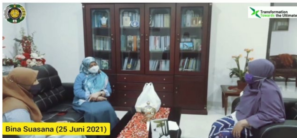
Gambar 1. Bina Suasana dengan Puskemas Pulo Brayan