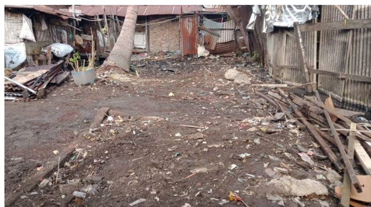
Gambar 16. Land Clearing Lokasi Pembangunan Model Jamban Sehat