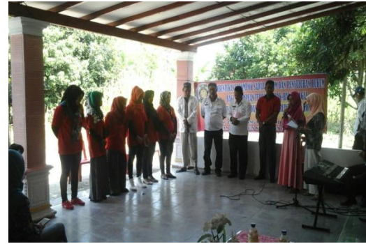
Gambar 8. Pelantikan Kelompok Sadar Hukum Oleh Camat Kecamatan Batang Kuis Kab Deli Serdang