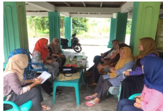
Gambar 3. : Pada Saat Pelatihan