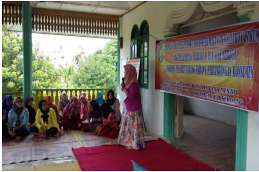
Gambar 1. : Foto Pada Saat Penyuluhan