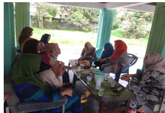
Gambar 4. : Pada Saat Pelatihan