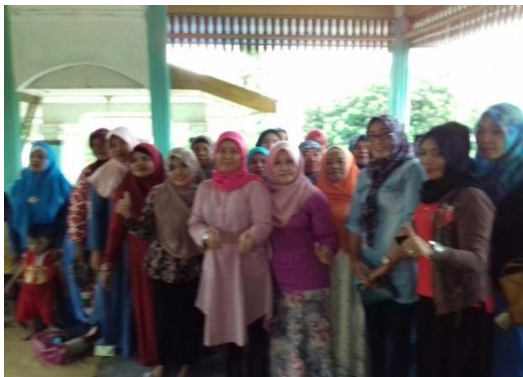
Gambar 2. : Foto Bersama Masyarakat yang Mengikuti Peyuluhan

Tim pengabdian dan kelompok sadar hukum yang telah dipilih selanjutnya akan mengadakan pertemuan kembali untuk membahas dan mendiskusikan permasalahan-permasalahan dalam hal perlindungan konsumen. Pertemuan akan dilakukan secara berkala untuk meningkatkan pengetahuan kelompok sadar hukum tersebut sehingga mereka dapat melaksanakan tugasnya selanjutnya menyampaikan informasi dan memberikan penjelasan kepada masyarakat tentang perlindungan konsumen khususnya dan permasalahan-permasalahan hukum lainnya secara umum.