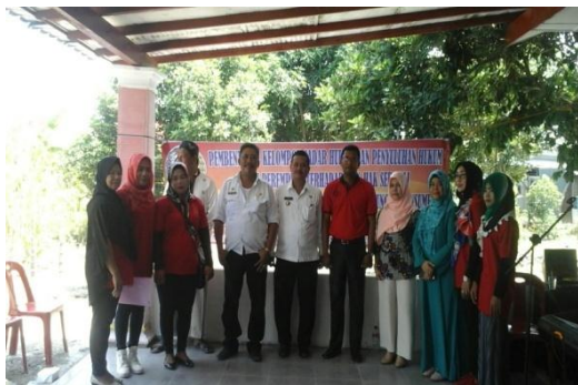
Gambar 7. Pelantikan Kelompok Sadar Hukum Oleh Camat Kecamatan Batang Kuis Kab Deli Serdang