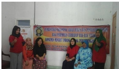
Gambar 6. Tim Monitoring LPPM USU Bersama Tim Pengabdian dan Kelompok Sadar Hukum