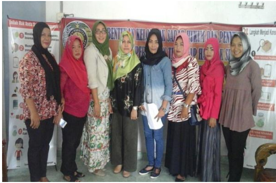
Gambar 5. : Pada Saat Selesai Pelatihan