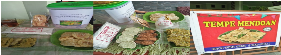
Mendoan dan Keripik Tempe Promosi Produk Tempe teh hijau, cokelat, cabe merah Gambar 3. Aneka Olahan Tempe

produk olahan tempe yang dijual UKM Mitra Olahan Rumah Tempe USU.