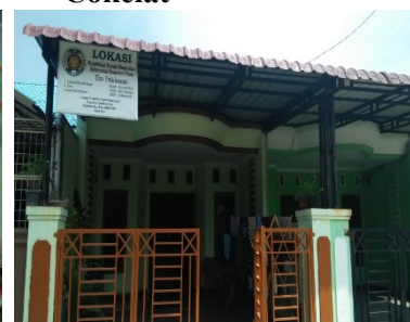
Lokasi pengabdian mitra-1