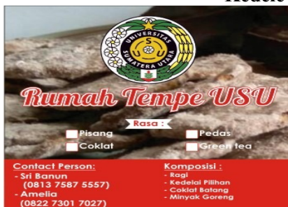
Keripik tempe original