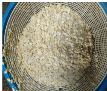
Kedele Soja sp