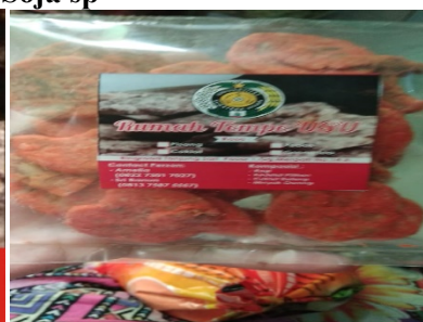
Keripik tempe pedas