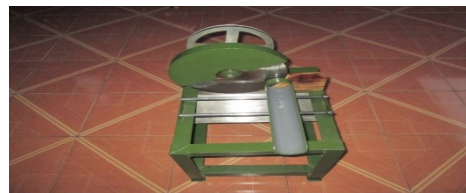
Gambar 5. Alat Pengiris Tempe