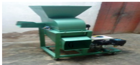
Gambar 4. Alat Pencacah Tempe

Gambar 4 dan Gambar 5 menunjukkan mesin pencacah dan pisau pengiris keripik tempe.