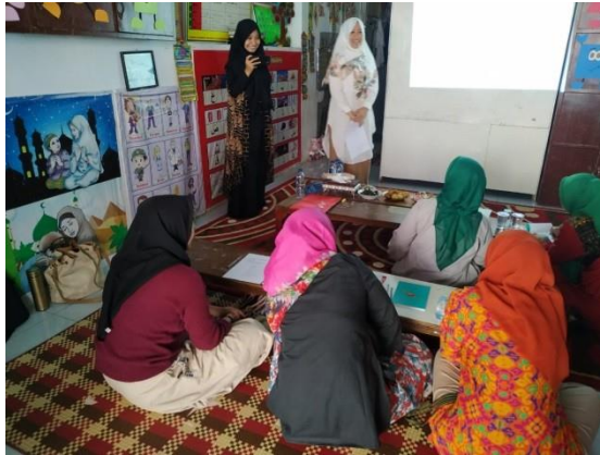
Gambar 3.2 Suasana pelatihan dengan pra pendidik Yayasan Pendidikan Islam Ar-Rahmah