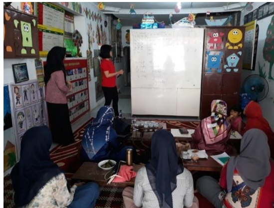
Gambar 3.3 Pelatihan tentang konsonan nada dan sistem pinyin