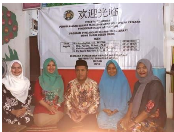
Gambar 3.5 Foto bersama Tim PKM USU dengan pihak Mitra dan pengawas RA kecamatan Medan Johor

Pelatihan dilakukan dengan baik dan intensif. Melihat keseriusan dan antusias seluruh peserta pelatihan, kegiatan yang dilakukan membuahkan hasil yang optimal dan sesuai dengan yang diharapkan. Para tenaga pendidik telah mampu menguasai materi pembelajaran bahasa Mandarin sebagaimana yang telah diberikan pada saat pelatihan. Tim PKM USU berharap pelatihan yang lebih serius dan mendalam mengenai pembelajaran bahasa Mandarin dapat dilaksanakan kembali baik di RA Ar-Rahmah maupun di sekolah-sekolah lainnya.