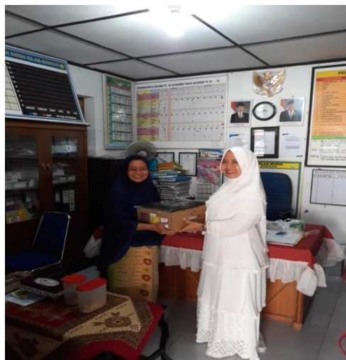
Gambar 3.4 Penyerahan LCD Projector dari Tim PKM USU kepada Pihak Mitra