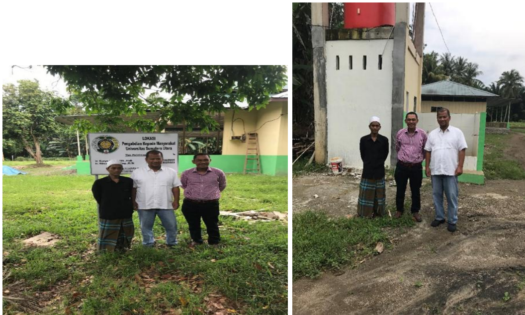
Gambar 3.6. Foto tim pengabdian beserta tim monitoring & evaluasi dan pengurus pesantren.

Setelah dilakukan pemasangan instalasi pemipaan dan pompa air bersih beserta perlengkapannya maka dilakukan penyuluhan singkat dan padat tentang penggunaan dan perawatan peralatan seperti tersebut di atas. Hal ini dilakukan agar sistem perawatan terhadap fasilitas tersebut dapat maksimal sehingga usia pakai peralatan dapat menjadi lebih lama.