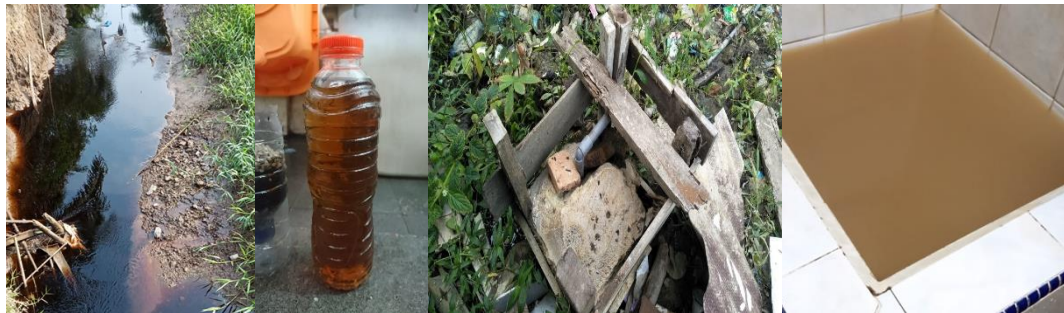
(a) (b) (c) Gambar 1. Kondisi sumber air desa yaitu air gambut, air sumur bor (asin), dan air sungai Barumun (keruh)

jam menggunakan mobil) dikarenakan jalan yang rusak parah ketika menuju ke lokasi. Oleh karena itu Desa Sei Siarti merupakan salah satu desa terpencil yang terletak di Kecamatan Panai Tengah Kabupaten Labuhanbatu Sumatera Utara.