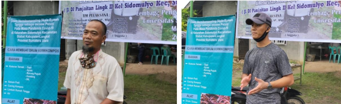
Gambar 3.4. Kesan dan pesan terhadap kegiatan pengabdian yang dilakukan tim USU ketua kelompok tani (kiri) dan petani muda (kanan).