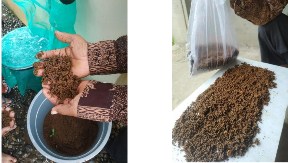
Gambar 3.7. Pengambilan sampel kompos untuk di analisis di laboratorium.