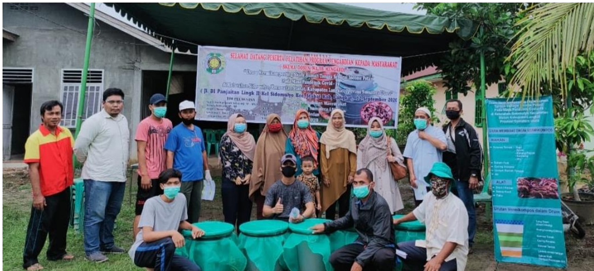
Gambar 3.5. Tim pengabdian dosen wajib mengabdikan USU tahun 2020 bersama mitra.

Setelah praktek pembuatan vermicompos selesai dilakukan, masing-masing petani diberikan drum vermicomposting untuk dibawa ke rumah masing-masing. Selama proses pengomposan, tim pengabdian tetap melakukan monitoring by phone untuk mengetahui perkembangan proses pengomposan. Setelah kompos matang dengan ciri-ciri tidak berbau; remah; berwarna kehitaman, maka beberapa sampel diambil untuk dibawa ke laboratorium agar dianalisis kandungan hara nya.