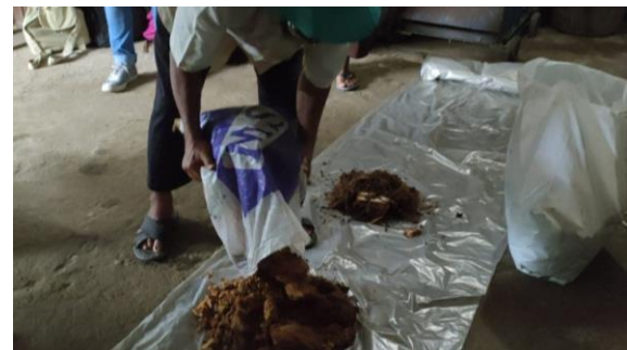
Gambar 3.2. Bahan-bahan yang digunakan dalam pembuatan drum vermicompos.