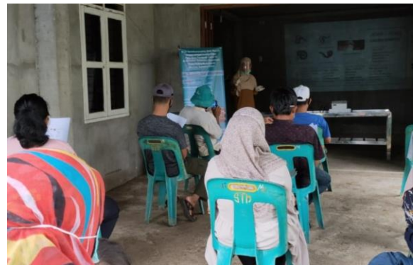
Gambar 3.1. Pemaparan materi oleh ketua tim pengabdian dosen wajib mengabdikan 2020.