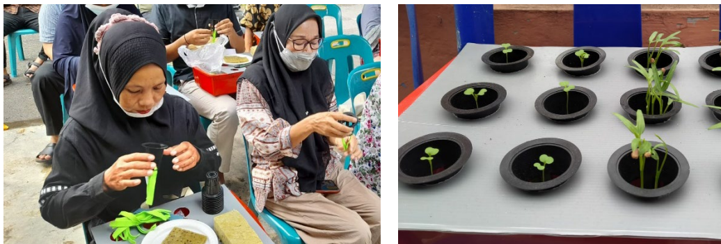
Gambar 4. Persiapan net pot yang dipasang kain panel dan bibit yang telah dipindahkan ke baki hidroponik

Penyemaian dengan menggunakan piring sterofoam dilakukan selama 7-10 hari atau sampai daun telah tumbuh 3 helai, untuk selanjutnya dipindahkan ke baki hidroponik (Gambar 4). Peserta juga diberi pelatihan tentang membuat larutan air dan nutrisi A-B Mix. Untuk 1 liter air dibutuhkan 5 ml unsur A dan 5 ml unsur B. Nutrisi A-B Mix atau pupuk racikan adalah larutan yang dibuat dari bahan kimia yang diberikan melalui media tanam, yang berfungsi sebagai nutrisi tanaman agar tanaman dapat tumbuh dengan baik. Nutrisi atau pupuk racikan mengandung unsur makro dan mikro yang dikombinasikan sedemikian rupa sebagai nutrisi. Nutrisi hidroponik atau pupuk A-B Mix diformulasikan secara khusus sesuai dengan jenis tanaman seperti tanaman buah (Paprika, Tomat, Melon) dan Sayuran Daun (Selada, Pakchoy, Caisim, Bayam, Horenzo dsb), Stroberi, Mawar, Krisan dan lain-lain [3].