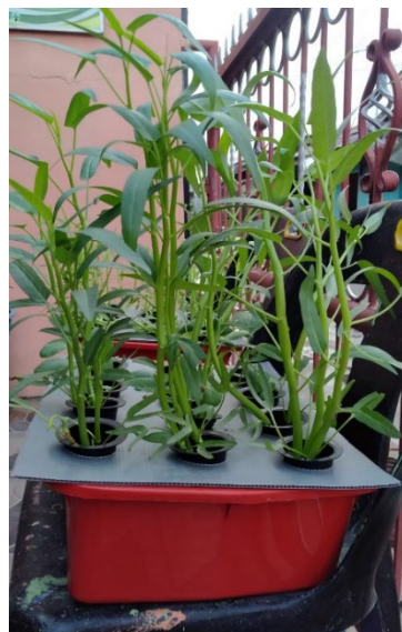
Gambar 5. Kangkung siap panen pada sistem hidroponik wick

Tanaman sayuran dipanen setelah 3 minggu setelah pindah tanam. Tanaman sayur yang siap dipanen secara umum cukup segar dan membuat peserta semakin tertarik untuk menerapkannya di pekarangan rumah (Gambar 5).