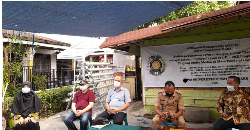
Gambar 2. Pembukaan acara pengabdian kepada masyarakat

Kegiatan pengabdian diawali dengan pembukaan oleh Tim Pengabdian USU dan Kepala Lingkungan XV dan kata sambutan dari perwakilan kelurahan Tanjung Mulia (Gambar 2). Selanjutnya dilakukan pemaparan materi hidroponik.