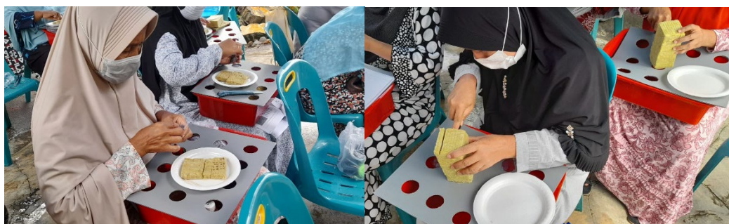
Gambar 3. Pemotongan rock wool dan penyemaian benih

Materi yang dipaparkan meliputi sejarah dan pengertian hidroponik, kelebihan hidroponik, media tanam dan media pot, jenis-jenis hidroponik, jenis-jenis sayuran yang dibudidayakan melalui sistem hidroponik, tahapan budidaya sayuran hidroponik, pembuatan pestisida nabati dan panen. Penyampaian materi ini dilakukan untuk memberikan pemahaman kepada masyarakat secara teoritis. Pemahaman terhadap materi hidroponik sangat berpengaruh pada keterampilan dalam budidaya sayuran hidroponik untuk tingkat dasar. Setelah pemaparan materi hidroponik selesai, dilanjutkan dengan demonstrasi pembuatan sistem hidroponik langsung di Kantor Kepala Lingkungan XV Tanjung Mulia Medan. Kegiatan dimulai dengan pemotongan rockwool , persiapan media, dan penyemaian benih sawi dan kangkung (Gambar 3).