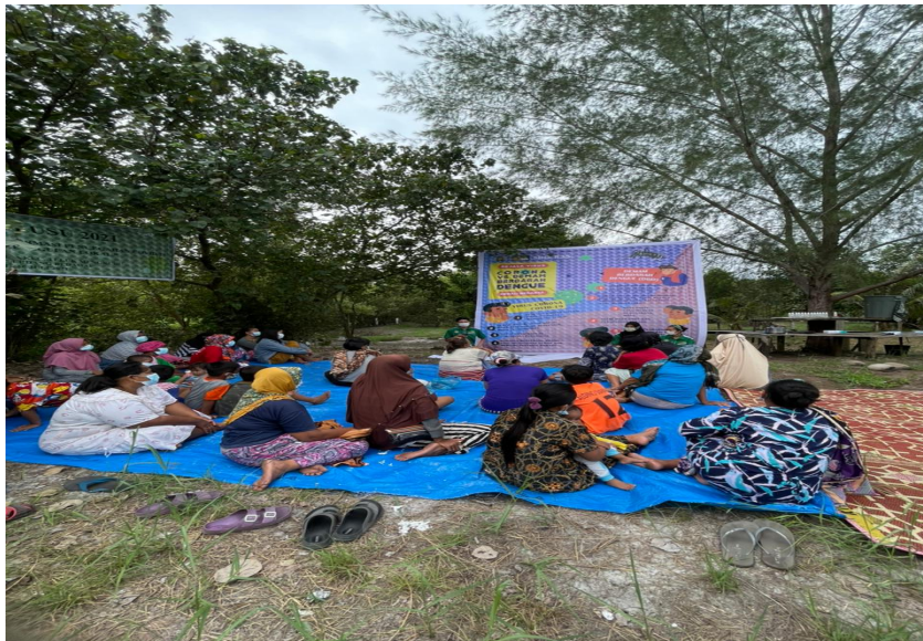
Gambar 6. Warga antusias mengikuti sosialisasi perbedaan Covid-19 dengan Demam Berdarah

Setelah melakukan sosialisasi tersebut, Kelompok KKN USU SBG Regu 35 melakukan monitoring dan evaluasi kepada masyarakat Desa Pematang Kuala. Dari hasil monitoring dan evaluasi yang dilakukan oleh Kelompok KKN USU SBG Regu 35, masyarakat Desa Pematang Kuala sudah memahami dan mengerti mengenai materi yang telah disosialisasikan sebelumnya. Hal ini terlihat dari munculnya rasa keberanian dari masyarakat desa untuk berobat ke puskesmas, dimana masyarakat desa sebelumnya tidak berani untuk berobat karena kurangnya pemahaman masyarakat mengenai Perbedaan Covid-19 dengan Demam Berdarah (DBD)