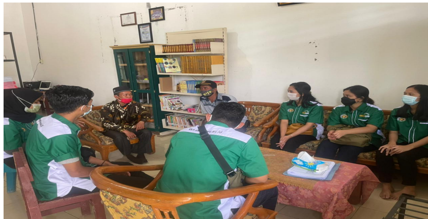
Gambar 3. Tim KKN disambut Kepala Desa Pematang Kuala.Kecamatan Teluk Mengkudu Kabupaten Sedang Bedagai