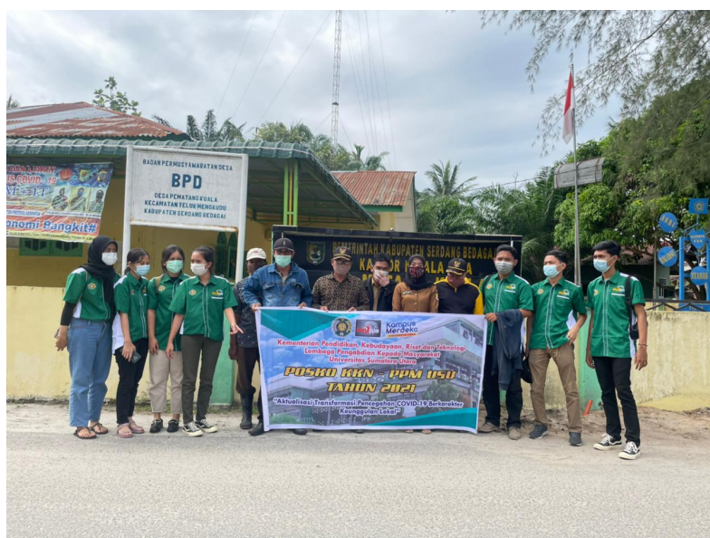
Gambar 4. Posku KKN SRG 35 di Kantor Desa Pematang Kuala Kecamatan Teluk Mengkudu Kabupaten Sedang Bedagai