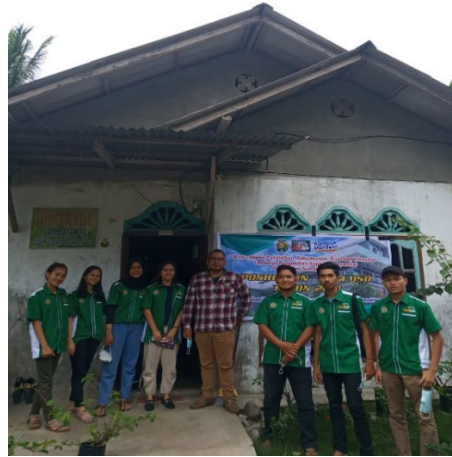
Gambar 2. Persiapan Tim Pengabdian dan Kelompok KKN SRG 35 di Desa Pematang Kuala Kecamatan Teluk Mengkudu Kabupaten Serdang Bedagai Tahun 2021