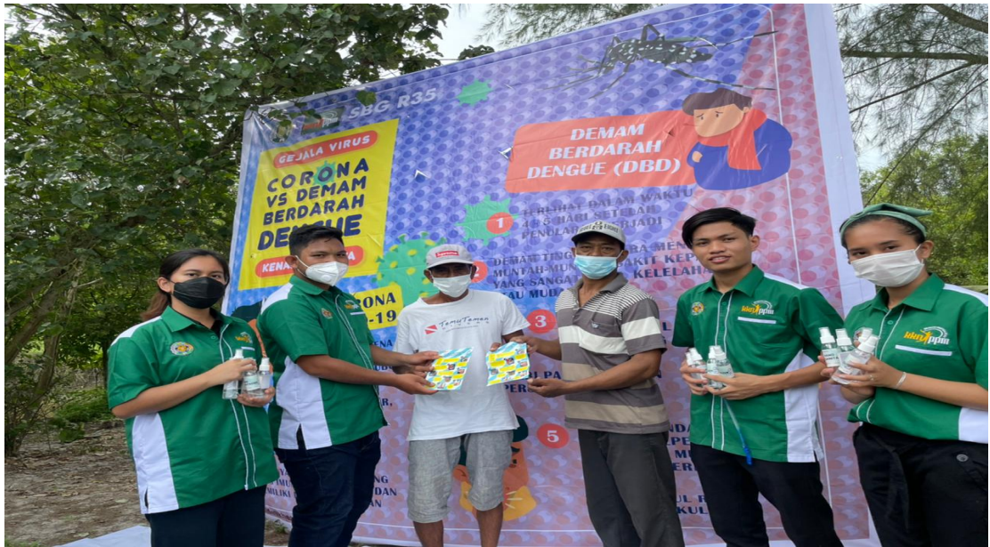
Gambar 5. Sosialisasi Perbedaan Penyakit dan Gejala Covid 19 dengan Demam Berdarah (DBD) di Desa Pematang Kuala, Kecamatan Teluk Mengkudu Kabupaten Serdang Bedagai tahun 2021 (KKN USU)

Sosialisasi yang dilaksanakan Kelompok KKN USU SBG Regu 35 ini diikuti oleh 50 orang masyarakat Desa Pematang Kuala yang dilaksanakan di ruang terbuka/halaman luas dengan tetap menerapkan protokol kesehatan, dan masyarakat yang hadir menyambut Kelompok KKN USU SBG Regu 35 dengan sambutan hangat dan rasa antusias yang tinggi. Kelompok KKN USU SBG Regu 35 sebelum melaksanakan kegiatan ini, mempersiapkan bahan dan materi dengan membuat power point yang menarik dan isi materi yang mudah dipahami oleh masyarakat Desa Pematang Kuala. Selain itu sebelum sosialisasi ini dilaksanakan, Kelompok KKN USU SBG Regu 35 juga menyediakan masker dan tempat untuk mencuci tangan yang mana hal ini dipersiapkan juga untuk mencegah tertularnya Covid-19 karena cukup banyak masyarakat yang ikut menjadi peserta dalam kegiatan sosialisasi ini. Semua materi sosialisasi yang disampaikan oleh Kelompok KKN USU SBG Regu 35 dapat diterima dan dapat dipahami dengan baik oleh masyarakat yang hadir dalam kegiatan sosialisasi ini. Masyarakat Desa Pematang Kuala juga berantusias untuk menambah wawasan mereka dengan bertanya dan berdiskusi kepada pemateri sosialisasi yaitu Kelompok KKN USU SBG Regu 35. Dengan melakukan kegiatan sosialisasi ini secara kontinyu, maka masyarakat dapat menerapkan ilmu yang di dapat dari kegiatan sosialisasi ini ke kehidupan sehari-hari masyarakat.