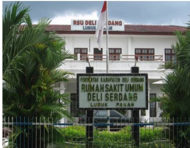
Gambar 3. Tampak depan Rumah Sakit

orang, ANESTESIOLOGI 3 orang, PATOLOGI KLINIK 6 orang, PATOLOGI ANATOMI 3 orang, RADIOLOGI 1 orang.