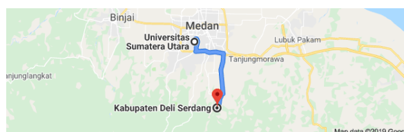
Gambar 2. Jarak Universitas Sumatera Utara ke Kab.Deli Serdang, 25,7 Km

Rumah Sakit Umum Daerah Lubuk Pakam yang beralamat di Jl. MH Thamrin 99 Lubuk Pakam Sumatera Utara, hanya berjarak ± 25,7 km dengan jarak tempuh 30 menit [2]. Wilayah kerja efektif di 14 Kecamatan dari 22 Kecamatan yang ada di Kabupaten Deli Serdang, dengan jumlah penduduk sekitar 185 juta jiwa, merupakan Pusat Rujukan Pelayanan dengan status Kelas B Non