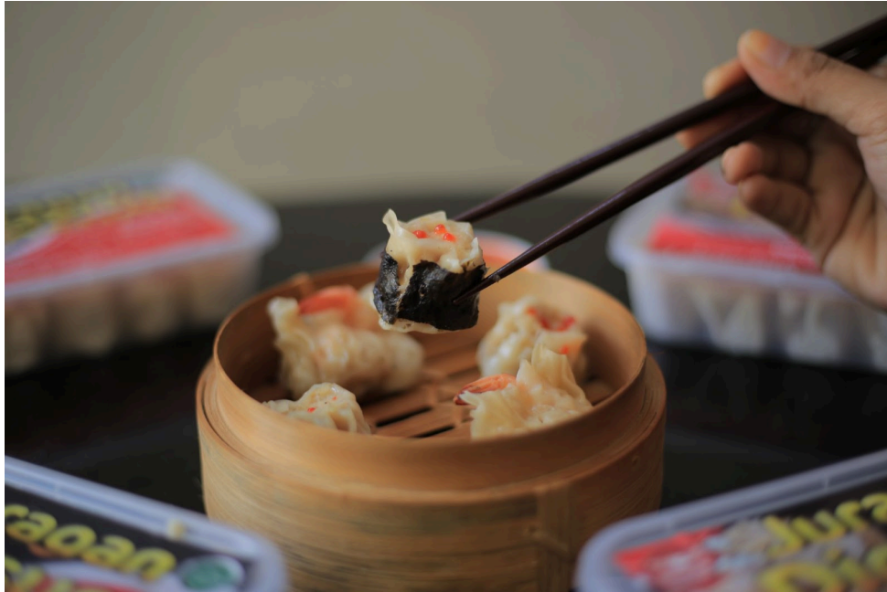
Gambar 4. Hasil foto produk