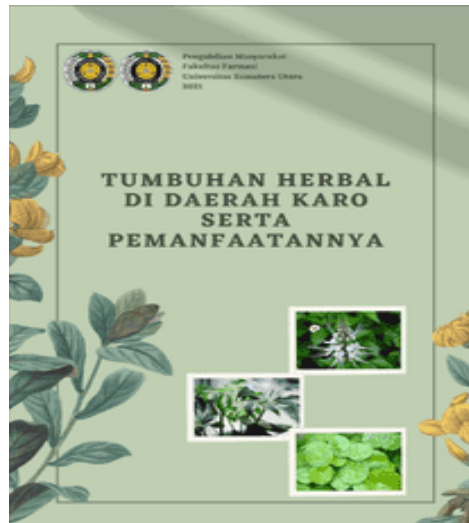
Gambar 1. Booklet tumbuhan herbal di daerah karo serta pemanfaatannya

Penyuluhan dilakukan dengan menggunakan labtop dan LCD proyektor yang di tampilkan dihadapan peserta dengan tampilan desain yang menarik sehingga tidak membuat peserta bosan.