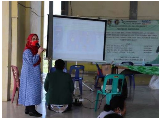
Gambar 2. Pemaparan ceramah

Pengabdian dihadiri oleh 30 orang ibu-ibu PKK di desa ndokum siroba Kabupaten Karo. Kegiatan dilaksanakan di balai desa dengan menerapkan protokol kesehatan. Peserta diberikan booklet tumbuhan herbal di daerah karo serta pemanfaatannya selain itu dilakukan penyuluhan mendetail terkait penyakit degeneratif dan obat herbal yang dapat dimanfaatkan. Peserta diminta mengisi kuisioner untuk melihat sejauh mana pengetahuan masyarakat terkait penyuluhan dan pelatihan ini.