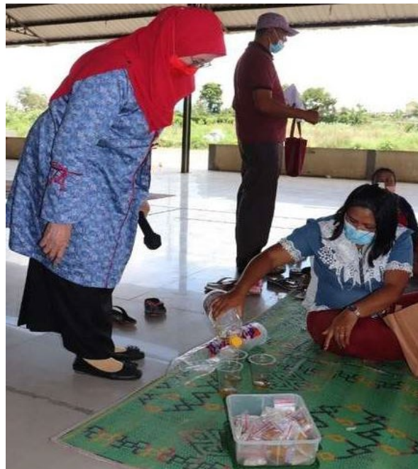
Gambar 4. sampling hasil demonstrasi pembuatan olahan herbal

Pada akhir sesi kegiatan masyarakat diminta untuk mengisi kuisioner kembali untuk melihat perbedaan pengetahuan peserta setelah mengikuti penyuluhan dan pelatihan tersebut, kemudian peserta diberikan waktu untuk bertanya terkait materi dan pelatihan yang disampaikan, dari banyaknya pertanyaan terlihat antusiasme dari peserta untuk mengetahui materi tersebut.