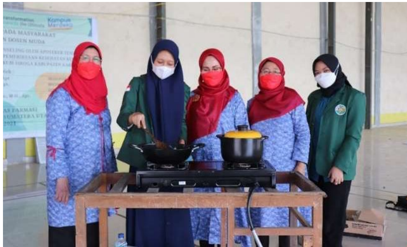
Gambar 3. Pemaparan demonstrasi pembuatan olahan herbal