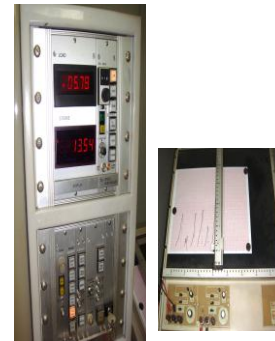
Gambar 4. Mesi dihubungkan pada alat uji yang menunjukkan pada kekuatan berapa breket lepas

Analisis data dengan menggunakan uji Anova satu arah ( p < 0,05 ) dan post hoc test untuk melihat perbedaan pengaruh larutan dan gel khlorheksidin dengan konsentrasi yang berbeda terhadap kekuatan geser breket (0,2% dan 0,12% khlorheksidin).