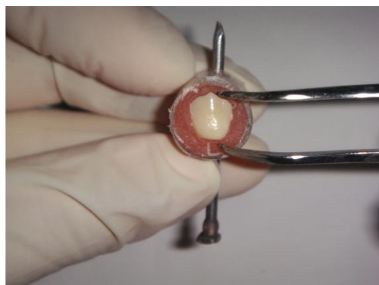
Gambar 1. Penanaman gigi pada tabung plastik yang diisi dengan self curing akrilik

Tabung plastik/sprit dipotong-potong dengan panjang 1,5 cm. Kemudian pada tabung plastik dilakukan pembuatan lubang dengan menggunakan bur fraser , lubang tersebut sebagai tempat paku yang berguna sebagai retensi pada uji perlekatan. Sprit yang sudah dipotong dan dilubangi kemudian diisi dengan bahan self curing akrilik, gigi ditanam ke dalam self curing akrilik dengan permukaan bukal gigi menghadap ke atas (Gambar 1). Bagian palatal gigi diberi pelekat sianokrilat ( Alteco ) sebagai perlekatan antara gigi dan akrilik. Sampel gigi ditanam sebatas sprit. Paku yang sudah diberi vaselin dimasukkan ke dalam lubang pada sprit. Sesaat sebelum bahan self curing mengeras, paku ditarik keluar. Sampel yang sudah ditanam, direndam kembali dalam larutan NaCl.