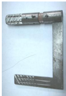
Gambar 2. Sampel dimasukkan ke dalam tabung baja

Mesin dihubungkan dengan alat yang dapat menunjukkan pada kekuatan berapa breket lepas (Gambar 4). Kriteria yang termasuk dalam penelitian ini bila lepasnya breket terletak antara enamel dan bahan bondingnya. Data yang diperoleh alat uji berupa load dalam satuan kgf.