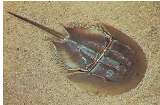
Gambar 2. Kitosan Blangkas 4

rajungan. Kitosan bermolekul tinggi berat molekulnya berkisar 800.000-1.100.000 Mv biasanya didapat dari hewan laut bercangkang keras seperti kepiting, kerang dan blangkas (Gambar 2). 1,4