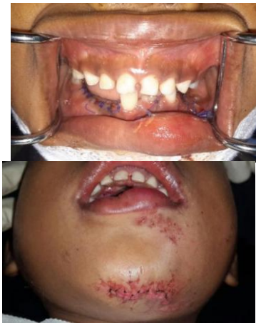
Gambar 5 Foto paska tindakan emergensi

Berdasarkan pemeriksaan klinis dan rontgen panoramik maka pasien didiagnosa dengan fraktur korpus mandibula sinistra. Di ruang emergensi dilakukan tindakan pencabutan gigi 75,74,73,82,81 dengan kegoyangan tingkat 3 serta alveolektomi dan penjahitan vulnus laceratum intraoral dan ekstraoral (gambar 5). Pasien dimasukkan ke ruang rawat inap untuk perbaikan keadaan umum serta persiapan reduksi tertutup didalam anestesi umum.