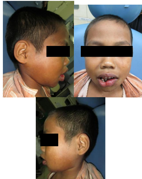
Gambar 1 Profil wajah pre operasi

Pada pemeriksaan fisik, secara umum tidak ditemukan adanya kelainan, kesadaran compos mentis serta vital sign dalam batas normal. Pada pemeriksaan ekstraoral ditemukan wajah asimetris, edema pada mandibula regio sinistra (gambar 1). Pada pemeriksaan intra oral terdapat: pembukaan mulut normal, step displacement tulang pada area lingual mandibula regio sinistra, edema pada region labialis inferior, bekas penjahitan pada regio mentalis, labialis inferior dan mukosa bukal regio sinistra, vulnus laceratum pada regio gingiva gigi 36, 75-85; vulnus abrasivum pada regio mentalis; kegoyangan tingkat 3 gigi 75,74,73,82,81 (gambar 2).