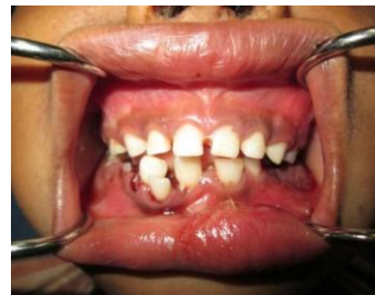
Gambar 2 Gambaran Intraoral

Pada pemeriksaan darah lengkap, terlihat kadar leukosit dan kadar gula darah yang meninggi sebagai akibat dari proses infeksi dan inflamasi. Hasil pencitraan radiografis yaitu Schedel AP-Lateral tidak terlihat dengan jelas gambaran radiolusen garis fraktur (gambar 3). Sedangkan pada pencitraan panoramik terlihat ada gambaran radiolusen garis fraktur di mesial gigi 36 yang meluas hingga border mandibula sinistra (gambar 4).