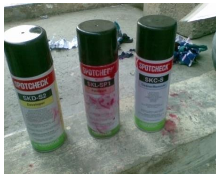
Gambar 3. Cairan Penetrant Test