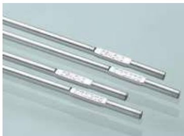
Gambar 2. Kawat las AWS-A5.2.

Kawat las yang terbuat dari aluminium dan ada yang terbuat dari campuran fosfor dan perunggu ( bronze ) yang dipakai untuk menyambung dan membentuk lapisan pada aluminium, steel dan cast iron , kuningan, dan sebagainya.