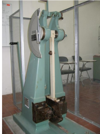
Gambar 1. Mesin uji impact Charpy.

Usaha yang dilakukan pendulum waktu memukul benda uji atau energi yang diserap benda uji sampai patah didapat rumus yaitu :