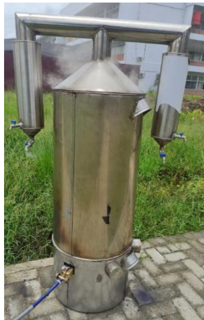
Gambar 3. Super BT01 (Laboratorium Biotan FP USU)