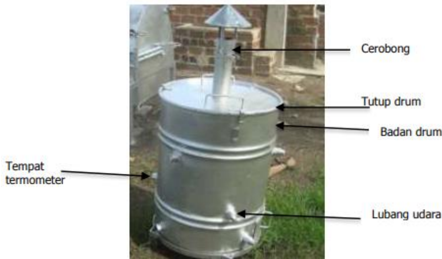
Gambar 2. Pirolisator dari drum (IPB) (Neneng et al. , 2015)

Pada teknik retort, merupakan pembakaran biomassa secara tidak langsung, ada 2 jenis yaitu retort terbuka dan retort tertutup atau juga disebut Roasting, seperti mana kopi yang di roasting menghasilkan banyak asam organik yg bermanfaat, demikian juga biomassa yg diroasting. alat yang digunakan adalah tabung besar dari tembaga yang dimodifikasi sangat eksklusif lalu menambahkan pembuatan asap cair dari pemanasan biomassa di dalam alat thermolisis. Setelah itu pemanasan menggunakan kompor gas akan mempercepat naiknya suhu tabung pirolisis, memanaskan biomassa sehingga menjadi biochar. Saat biomassa sudah kering, masukkan biomassa tersebut ke dalam tabung thermolisis dan dipanggang menggunakan sumber panas/ kompor dengan suhu tinggi dari bawah yang letaknya di atas tabung penyangga (Prasetiyo et al., 2020). Contoh alatnya dapat dilihat pada gambar dibawah ini.