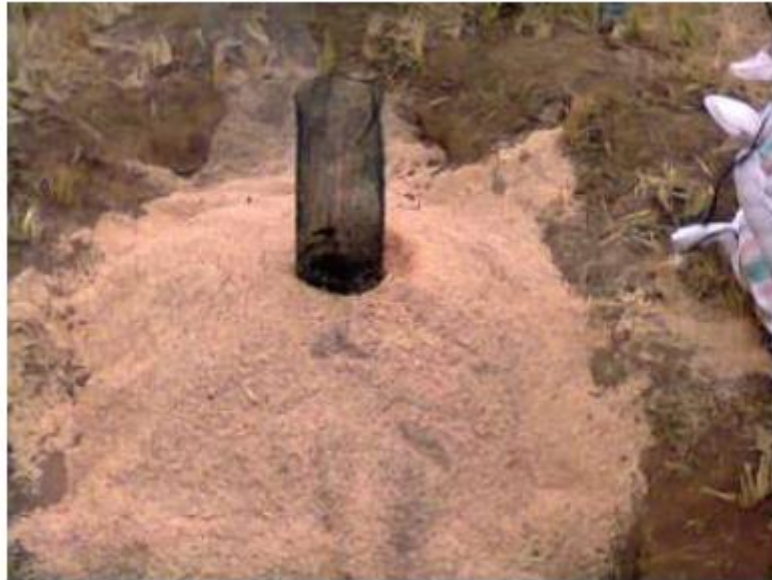
Gambar 4. Teknik Klin pada pembuatan Biochar sekam padi (Neneng et al. , 2015).

Teknik Kiln digunakan dalam pembuatan biochar dengan membakar langsung biochar dengan keadaan oksigen terbatas, dengan Alat Modern menggunakan Nitrogen sehingga memastikan tidak terjadinya proses oksidasi, secara sederhana dapat menggunakan tabung tertutup dengan cerobong asap atau dengan mengali lubang tanah dengan tujuan mereduksi oksigen pada proses pembakaran, Dapat menggunakan alat yang terbuat dari lempengan plat besi yang dimodifikasi berbentuk drum dengan cerobong asap, penambahan kipas dan penutupnya diberi plat yang ditutup oleh penyatuan mor dan baut, biasanya alat ini dipakai untuk membakar semua jenis bahan biomassa. Biomassa dimasukkan ke dalam alat metode kiln apabila sudah dikeringkan, lalu dibakar dari atas dan kipas dinyalakan dari atas sehingga api turun ke bawah dan terbentuklah biochar (Prasetiyo et al. , 2020).