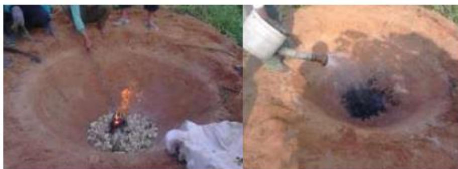
Gambar 5. Pembuatan biochar menggunakan Kontiki di KP Taman Bogo, Lampung Timur (Neneng et al. , 2015)

Kon-Tiki untuk produksi biochar dengan teknik Klin (pembakaran langsung pada biomassa) bisa dibuat dari plat besi yang berbentuk kerucut (cone) ataupun hanya dengan galian yang juga berbentuk kerucut (cone). Pembakaran dengan menggunakan Kon-Tiki dengan volume 2 m 3 dapat menghasilkan 500 kg biochar, dalam waktu 3 jam. Pembuatan biochar dengan metode Kon-Tiki yaitu pembakaran dengan sedikit asap. Pembakaran dilakukan secara bertahap, bahan pertama diletakkan sebagai sumber pengapian agar api dapat menyala. Ketika bahan tersebut sudah menyala sempurna, tambahkan kembali bahan lainnya, kemudian api dijaga agar tetap menyala. Proses tersebut dilakukan secara berulang hingga kapasitas Kon-Tiki terpenuhi. Proses dikatakan selesai jika sudah terbentuk lapisan abu pada bagian atas. Dari segi keamanan bagi lingkungan, Kon-Tiki dianggap relatif lebih baik karena konsentrasi CO dan NO x yang dihasilkan Kon-Tiki rendah. Proses pembakaran tanpa asap menjaga produksi bahan-bahan pencemar pada proses pembuatan biochar dengan Kon-Tiki selalu rendah (Jubaedah, 2014).