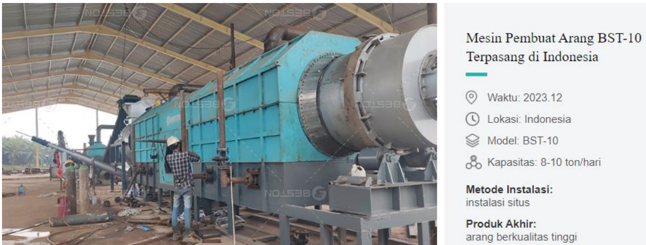
Gambar 6. Mesin pembuatan arang/biochar (Beston, 2024)

Seiring dengan meningkatnya kebutuhan akan biochar sebagai amandemen tanah pertanian yg potensial, maka banyak perusahaan yg mengembangkan pembuatan biochar untuk skala besar dengan memperhatikan mutu dan kualitas biochar yang dihasilkan, juga hasil sampingan berupa cuka kayu, TER dan syngas, seperti gambar dibawah ini.