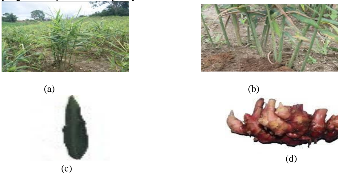
Gambar 3 : (a) Tanaman jahe berumur \pm 6 bulan (b) batang jahe (c) daun jahe (d) rimpang jahe

Diketahui beberapa karakter morfologis terdapat karakter yang sama pada jenis jahe yang diamati pada tanaman jahe yaitu :