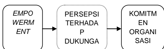
Gambar 3. 1. Kerangka pemikiran

Hipotesis penelitian adalah sebagai berikut :