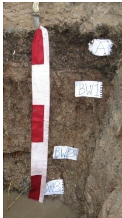
Gambar 1. Profil tanah di areal Rawapitu

Areal Rawapitu merupakan rawa belakang dari lembah aluvial luas yang terpengaruh oleh aliran sungai Pidada dan Tulang Bawang. Berdasarkan pengamatan profil tanah, tergolong dalam Sulfic Endoaquepts , bertekstur tanah liat, struktur tanah masif, drainase sangat terhambat, kandungan batuan <3%, kedalaman sulfidik >80 cm; pH 3,8-4,2; bentuk wilayah datar, ketinggian tempat 20 m dpl.