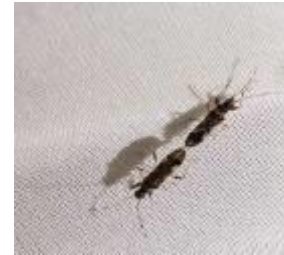
Gambar 3. Kopulasi

Hasil penelitian menunjukkan bahwa lama kopulasi rata-rata \pm 1 jam, terlama yaitu 1 jam 32 menit dan terjadi sore hari hingga pagi hari pukul 07.00. Salaki dan Senewe (2012) melaporkan bahwa serangga P. pallicornis aktif pada pagi dan sore. Lestari (2014) juga mengatakan bahwa P. pallicornis mengisap bulir-bulir padi pada pagi hari, pada sore hari serangga sangat aktif bergerak di bagian tanaman dan di bagian tanah. Imago betina ukurannya lebih besar dari jantan.