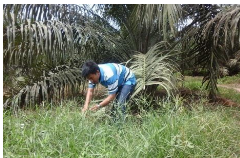
Gambar 1. Pengambilan biji E. indica dari perkebunan kelapa sawit di Kabupaten Langkat

Benih E. indica terlebih dahulu direndam dalam larutan kalium nitrat (KNO 3 ) dengan konsentrasi 0,2% selama 30 menit (Ismail et al. 2002). Perendaman ini bertujuan untuk mematahkan dormansi biji E. indica .