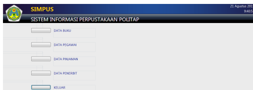
Gambar 2. Tampilan Menu Utama SIMPUS

Semua hasil rancangan yang telah dibuat dalam tahap perancangan akan diimplementasikan dengan bantuan Microsoft Access 2007, sehingga menghasilkan suatu sistem informasi manajemen perpustakaan (SIMPUS). Sistem informasi manajemen perpustakaan yang dihasilkan memiliki user interface (antarmuka pengguna) yang bersifat user friendly dan data-data di dalamnya dikelompokkan sesuai dengan sifatnya sehingga konsep Group Technology telah diterapkan di dalam sistem informasi manajemen perpustakaan yang dihasilkan. Adapun tampilan utama SIMPUS merupakan tampilan pertama kali masuk setelah memasukkan password pada perintah masukan password sebelum masuk SIMPUS.