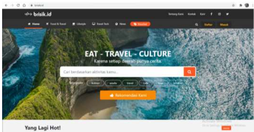
Gambar 1 Tampilan Website Brisik.id

Pada media online sendiri juga memanfaatkan konsep jurnalisme warga dalam mengisi konten mereka. Salah satu media online yang berbentuk website yang menerapkan jurnalisme warga yaitu Brisik.id . Brisik.id singkatan dari berita asik, adalah salah satu produk dari PT Galactic Multimedia (Oomph) yang didirikan pada Bulan September 2019 di Jakarta. Mengambil tagline eat, travel, dan culture , dulunya Brisik.id merupakan media online yang membahas secara general tentang politik, news, lifestyle, dan lainnya namun sekarang Brisik.id memfokuskan tulisannya dengan menggabungkan 3 (tiga) elemen yaitu kuliner, wisata, dan kebudayaan sebagai konten atau isi tulisan ( www.brisik.id ).