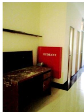
Gambar 4. Tata Letak Fire Hydrant Box yang Terhalang Perabot (FIA)