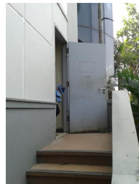
Gambar 2. Pintu Darurat Terbuka

Dari sisi manajemen pengelolaan gedung, perlu adanya perbaikan sistim menyangkut penggunaan pintu darurat yang sering digunakan untuk aktivitas sehari-hari. Hampir 50% dari sejumlah pintu darurat dapat dibuka dengan mudah baik dari dalam maupun luar bangunan. Bahkan di beberapa gedung, penghuni bangunan terlihat mengganjal pintu darurat agar tetap terbuka lebar. Juga menemukan sejumlah pintu darurat yang terkunci dari dalam.