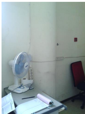
Gambar 6. Penggunaan Percabangan Listrik yang Terlalu Banyak

Kelaikan jaringan listrik di dalam gedung perlu mendapat perhatian lebih. Hal ini dikarenakan kegagalan sambungan listrik sering diketahui sebagai penyebab timbulnya api di dalam bangunan. Survey gedung dilakukan dengan melihat berbagai peralatan jaringan listrik yang digunakan penghuni beraktifitas, antara keberadaan extention cable, terminal cabang T, dan kerapian jaringan kabel ruangan. Penggunaan extention cable ditemukan banyak dijumpai dalam bangunan, bahkan perangkat tersebut digunakan sebagai sambungan permanen untuk berbagai peralatan listrik, misalnya AC dan perangkat komputer. Dari 66 titik pengamatan, lebih dari 50% mendapati extention cable digunakan sebagai sambungan permanen (Gambar 6).