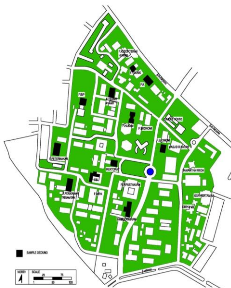
Gambar 1. Peta Sebaran Masa dan Akses Utama Kampus Universitas Brawijaya

Kampus UB memiliki 5 akses pencapaian utama dan beberapa akses cadangan yang bersinggungan dengan areal permukiman penduduk di sekitarnya. 3 akses utama berada di sisi Utara kampus di sepanjang Jalan M.Haryono, sedang 2 akses utama lainnya berada di sisi Jalan Vetaran (Selatan). Namun demikian dari kelima akses utama tersebut hanya 3 akses dapat dilewati kendaraan besar seperti halnya kendaraan damkar (Gambar 1).