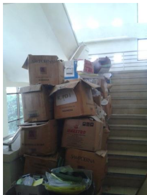
Gambar 3. Tumpukan Barang di Ruang Tangga Darurat

Sebagian besar tangga darurat gedung telah dilengkapi ruang transisi yang berguna untuk mengisolasi asap, namun namun belum dijumpai sistim pendorong udara yang mampu menghalau asap keluar dari ruang tangga darurat.