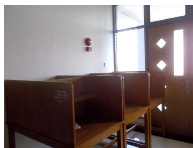
Gambar 5. Tata Letak Manual Fire Alarm yang Terhalang Perabot (FIA)