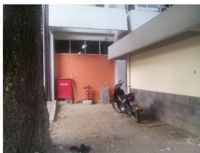
Gambar 7. Peletakan Hydrant Halaman Terlalu Rapat dengan Bangunan

Saat ini terdapat 13 titik hydrant halaman. Penempatan hydrant tersebut tersebut berada di antara gedung tinggi. Beberapa hydrant berada di lorong sempit koridor antar bangunan dan terlalu dekat dengan dinding luar bangunan (Gambar 7) sehingga menyulitkan operasional petugas damkar. Tiga diantaranya perlu perawatan dikarenakan kondisi fisiknya.