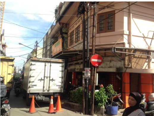
Gambar 4. Interface Jalan pada Jalan Pasar Selatan

Shophouse yang memiliki ketinggian interface satu lantai merupakan transformasi tipologi shophouse yang berasal dari tipe rumah dengan halaman dalam yang umum dan terkenal di Cina (Han & Beisi, 2015) (Gambar 4 dan 5). Tipe shophouse ini banyak ditemui di kota Quanzhou yang merupakan pelabuhan utama di Cina pada awal perdagangan Jalur Sutra Maritim menjadi gerbang keluar imigran asli Tionghoa dari daratan utama Cina. Sedangkan shophouse yang memiliki ketinggian interface dua lantai atau lebih merupakan tipologi shophouse yang umum di Asia Tenggara. Dari keberadaan shophouse yang memiliki ketinggian interface jalan satu lantai dapat dikatakan bahwa pada masa imigrasi terdapat imigran Tionghoa datang langsung dari Cina daratan utama yang masih menganut bentuk rumah asli dari tempatnya berasal. Namun kemudian seiring meningkatnya kemampuan ekonomi dan kebutuhan ruang, penghuni mengembangkan rumahnya secara vertikal.