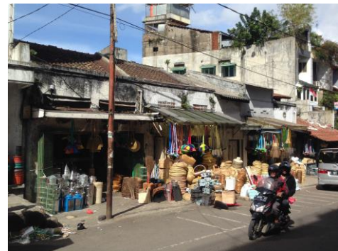
Gambar 3. Interface Jalan pada Jalan Belakang Pasar