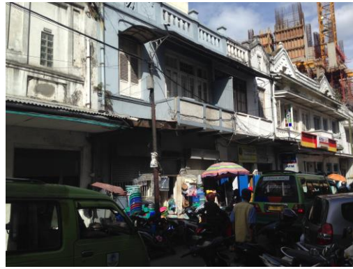
Gambar 5. Interface Jalan pada Jalan Pasar Selatan

Namun masih terdapatnya shophouse dengan ketinggian interface jalan satu lantai menunjukkan bahwa peningkatan kemampuan ekonomi yang didasari oleh bisnis yang dijalankan dalam shophouse tidak terjadi merata pada seluruh warga imigran Tionghoa. Hal ini terjadi karena para pedagang Tionghoa tidak pernah mendominasi perdagangan yang terjadi di pasar di kota Bandung (Siregar, 1990). Pedagang Pribumi di kota Bandung memiliki perserikatan yang cukup kuat dan menjadi pesaing utama pedagang imigran Tionghoa (Tunas, 2007).