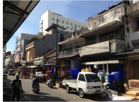
Gambar 2. Interface Jalan pada Jalan Belakang Pasar

Ketinggian interface jalan pada shophouse di jalan Belakang Pasar sangat bervariasi. Sebagian rumah memiliki ketinggian seragam yaitu satu lantai, sebagian rumah lainnya memiliki ketinggian dua lantai dengan keberadaan balkon di lantai dua, dan sebagian rumah lainnya memiliki ketinggian lebih dari dua lantai bahkan hingga empat lantai. Sedangkan pada Jalan Pasar Selatan ketinggian interface jalan relatif seragam, yaitu dengan ketinggian dua lantai (Gambar 2 dan 3).