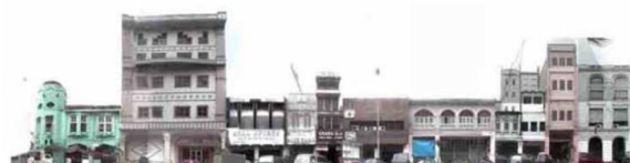
Gambar 9. Model Demolisi – Kekacauan Tampak

Keberhasilan tatanan urban architecture pada suatu koridor ditentukan oleh estetika susunan tampak bangunan yang secara normatif mengikuti rhythm yang harmonis (Ching, 2008). Rhythm tersebut tersusun atas elemen tunggal maupun kelompok bangunan. Dalam tinjauan elemen imaji kawasan arsitektur bangunan dapat secara potensial membangun karakter kawasan dalam wujud suatu landmarks (Lynch, 1979). Di Kawasan Kesawan kelompok bangunan justru membentuk landmark yang tidak berkarakter Kesawan akibat desain yang tidak kontekstual. Hal demikian menyumbang demolisi terhadap identitas kawasan Kesawan yang berakibat architecture sprawl . Di Kawasan Kesawan terdapat setidaknya sepuluh kelompok bangunan besar yang potensial sebagai aksent atau landmarks namun justru potensial menimbulkan architecture sprawl (Gambar 9, dan 10).