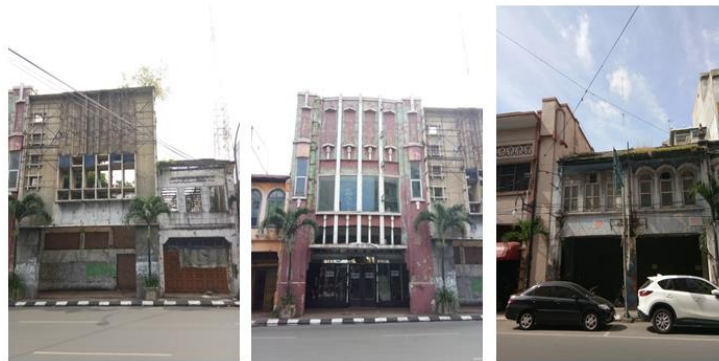
Gambar 1. Model Demolisi – Neglected

Tindakan demolisi dengan model pembiaran berupa pengabaian terhadap perawatan dan perbaikan gedung warisan. Keterbatasan daya tahan bahan material bangunan terhadap terpaan iklim mempercepat terjadinya pembusukan/pelapukan ( deterioration ). Dalam jangka waktu singkat bangunan akan lapuk (seringkali hal ini menjadi justifikasi perobohan/demolisi bangunan warisan budaya). Di Kawasan Kesawan tercatat sejumlah 14 bangunan dibiarkan terlantar mengalami pelapukan alami (Gambar 1).