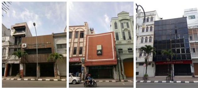
Gambar 6. Model Demolisi – Masking/Facelift

rupa tampak baru berteknologi bahan kontemporer.