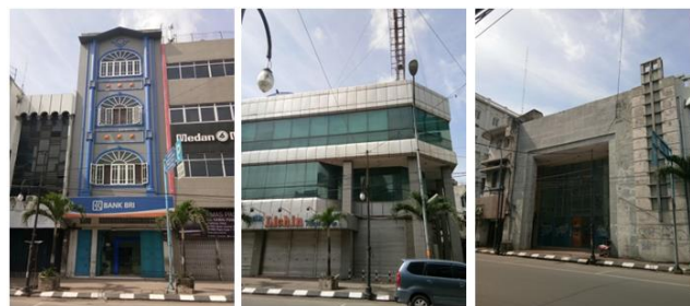
Gambar 5. Model Demolisi – Redesign

redesain berganti tampang menjadi arsitektur dengan langgam style yang tidak mencirikan dan kontekstual dengan arsitektur heritage Kesawan. Demolisi model redesain ini secara total menimbulkan demolisi terhadap citra kawasan Kesawan. Sejumlah 45 bangunan mengalami perubahan design (Gambar 5).