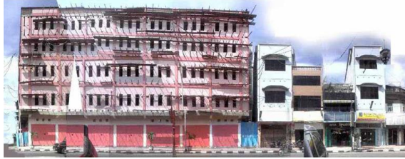
Gambar 10. Model Demolisi - Kekacauan Landmarks