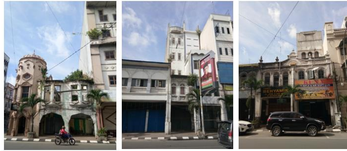
Gambar 2. Model Demolisi – Amputasi