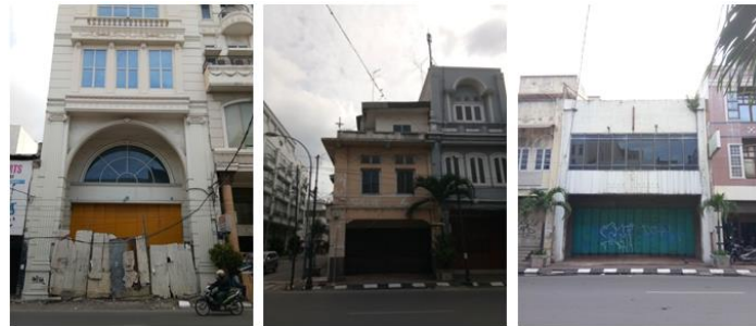
Gambar 4. Model Demolisi – Redesign

permanen yang ditandai dengan tidak terawatnya elemen eksterior facade maupun interior. Di Kesawan tercatat sejumlah 25 bangunan warisan tidak difungsikan secara optimal yang pada gilirannya menimbulkan ketiadaan karakter bangunan (devitalisasi) (Gambar 3).