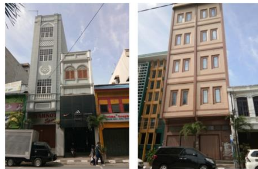
Gambar 8. Model Demolisi – Blurring Visual

Penambahan bangunan sebagaimana rekomendasi Marpaung (2004) mempunyai keterbatasan bagi pandangan seseorang terhadap karya arsitektur. Bangunan tinggi dengan jarak pandang terbatas hanya akan ternikmati sebatas 27 derajat oleh pengamat. Dengan demikian dapat difahami bahwa di Kesawan dahulunya hanya diperbolehkan membangun dengan ketinggian tiga lantai untuk memaksimalkan aras pandangan visual dengan penekanan ekspresi facade rendah yang menawan. Pada saat ini terdapat sekitar 14 bangunan gedung jangkung dengan ketinggian hingga 4 lantai atau lebih dengan posisi bahkan berjarak sangat dekat dengan jalan (GSB=1 meter). Model penghilangan visual ini menurunkan kualitas kenampakan facade bangunan bersejarah sekaligus menghilangkan elemen arsitektur warisan di tepian jalan Kawasan Kesawan.