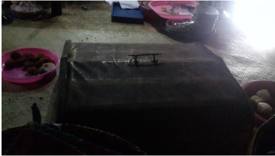
Gambar 10. Tudung saji

Di ruang persiapan sebagian besar peralatan rumah tangga yang digunakan masih tradisional seperti tudung saji (Gambar 10) yang terbuat dari kayu, tempat makanan yang terbuat dari anyaman bambu, tempat nasi dari bambu. Setelah masakan selesai dimasak akan diletakkan di meja besar yang terbuat dari kayu yang dilapisi anyaman bambu.