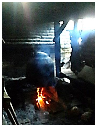
Gambar 11. Perapian Untuk Memasak

Sebagian besar peralatan memasak yang digunakan masih tradisional yaitu dari batok kelapa yang telah dikeringkan tanpa menggunakan kompor yang modern. Hal ini menunjukkan bahwa dalam kehidupan sehari-hari di Kabuyutan Trusmi masih menggunakan cara tradisional tanpa mengikuti perkembangan teknologi yang ada saat ini. Berdasarkan peralatan masak serta cara memasak di kabuyutan Trusmi mencerminkan kearifan lokal, dimana penggunaan alat-alat modern tidak mendominasi kehidupan. Hal ini tercermin dari penggunaan alat memasak dari tanah liat dan kayu (Gambar 11, dan 12).