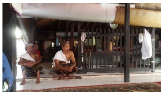
Gambar 9. Ruang Persiapan

Di kabuyutan Trusmi terdapat dapur atau pawon yang terdiri dari ruang memasak dan persiapan. Ruang memasak dibuat terpisah dari ruang persiapan. Pawon digunakan untuk memasak makanan, khususnya pada upacara keagamaan dan upacara adat. Ketika akan masuk ke dapur, orang akan menunduk dikarenakan tinggi dapur yang cukup rendah. Ruang persiapan berada di sisi utara sedangkan ruang memasak berada di sisi barat. Ruang persiapan digunakan untuk meletakkan makanan yang telah selesai dimasak, sedangkan ruang memasak digunakan untuk memasak makanan serta mencuci bahan makanan dan mencuci alat masak (Gambar 9).