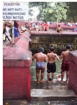
Gambar 8. Pekulahan

Pekulahan adalah suatu sumber air pertama yang ada di muka bumi yang menurut kepercayaan dapat mengobati orang sakit dan menyucikan badan dari segala hal, baik gaib dan yang nyata (Gambar 8). Sedangkan Witanan sendiri, adalah tanah pertama yang ada dimuka bumi. Adanya Pekulahan (Sumber Air Pertama) dan Witana (Tanah Pertama) menjadi bukti akan sejarah panjang perjuangan dalam menyebarkan Islam di Cirebon, khususnya di Trusmi. Saat ini, fungsi pekulahan telah mengalami perubahan yaitu sebagai kolam bermain anak-anak sekitar kabuyutan Trusmi.