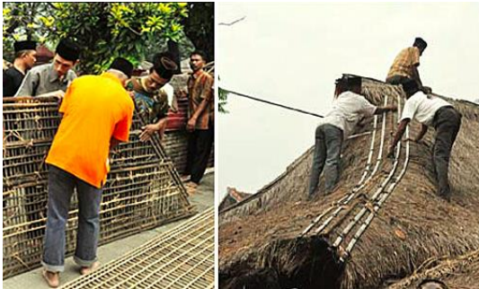
Gambar 14. Penggantian Sirap

arakan kirab 14 tombak pusaka Ki Buyut, serta hasil bumi . Dalam acara ini ditampilkan tarian babak Yoso dan tari agung.