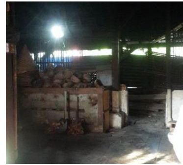
Gambar 12. Batok Kelapa yang Digunakan untuk Memasak

Pakaian adat dari Kabuyutan Trusmi yaitu menggunakan pakaian khas, dengan atasan putih (kain yang disematkan di badan) dan bawahan kain sarung atau jarik serta memakai iket kepala. Hal ini merupakan tradisi dari leluhur turun menurun yang masih dijaga sampai sekarang. Pakaian ini khusus di gunakan untuk kaum pria (Gambar 13).