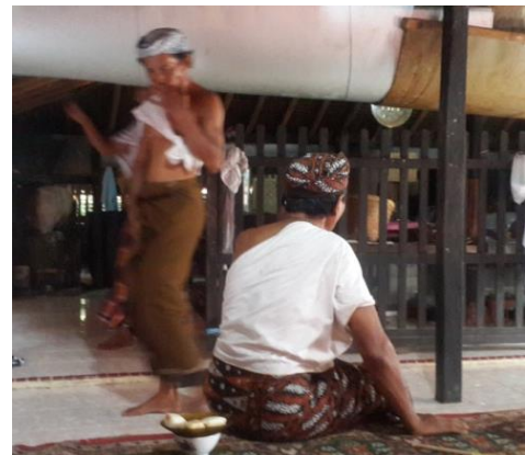
Gambar 13. Pakaian Khas Kabuyutan Trusmi

Pakaian adat dari Kabuyutan Trusmi yaitu menggunakan pakaian khas, dengan atasan putih (kain yang disematkan di badan) dan bawahan kain sarung atau jarik serta memakai iket kepala. Hal ini merupakan tradisi dari leluhur turun menurun yang masih dijaga sampai sekarang. Pakaian ini khusus di gunakan untuk kaum pria (Gambar 13).