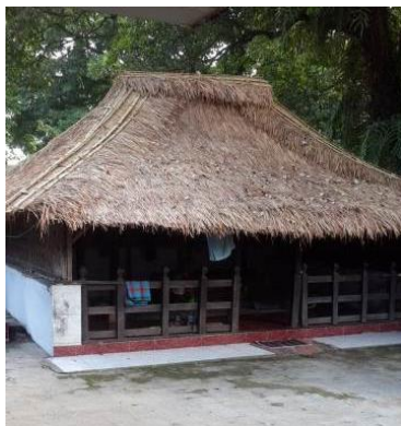
Gambar 6. Bale Peziarah

Tepat di pintu masuk utama, terdapat gerbang kori agung atau gerbang masuk situs. Gerbang kori agung merupakan gerbang dalam khasanah kebudayaan islam di Indonesia pada zaman madya dengan ciri-ciri fisik memiliki atap, berdaun pintu serta ukurannya pendek sehingga orang harus menunduk untuk melewatinya (Gambar 7).