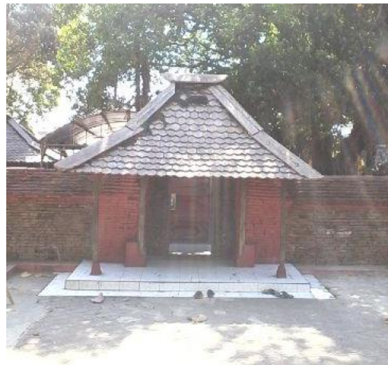
Gambar 3. Masjid di Kabuyutan Trusmi

ukuran pendek. (Mujabuddawat, M., 2013). Atap bangunan berbahan sirap dengan tinggi bangunan 250 meter dan tinggi bangunan 350 meter (Gambar 3).