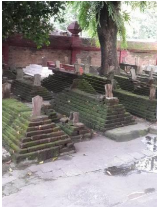
Gambar 5. Komplek Pemakaman

meter dan tinggi bangunan 290 meter. Dinding bale pesalinan terbuat dari bahan kayu serta anyaman bambu. Pada sisi samping bawah bale pesalinan, setengah dinding yang digunakan adalah dinding bata (Gambar 6).