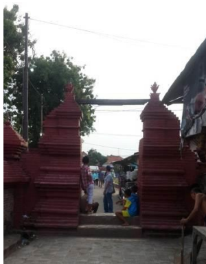
Gambar 7. Gerbang Kori Agung

Tepat di pintu masuk utama, terdapat gerbang kori agung atau gerbang masuk situs. Gerbang kori agung merupakan gerbang dalam khasanah kebudayaan islam di Indonesia pada zaman madya dengan ciri-ciri fisik memiliki atap, berdaun pintu serta ukurannya pendek sehingga orang harus menunduk untuk melewatinya (Gambar 7).