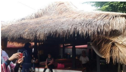
Gambar 2. Pendopo

Di dalam kompleks Kabuyutan Trusmi terdapat beberapa ruang yang digunakan sebagai aktivitas sehari-hari oleh kuncen dan pewaris kabuyutan. Seperti pendopo di Jawa, fungsi Pendopo di kompleks kabuyutan Trusmi digunakan sebagai tempat untuk menerima tamu serta untuk tempat berbincang-bincang. Atap pendopo berbahan sirap yang tidak terdapat dinding pada bangunan ini. Terdapat empat kolom, yang terbuat dari kayu yang menyangga atap pendopo. Semua atap bangunan di kompleks kabuyutan ini memakai sirap yang merupakan perwujudan dari kearifan lokal (Gambar 2).