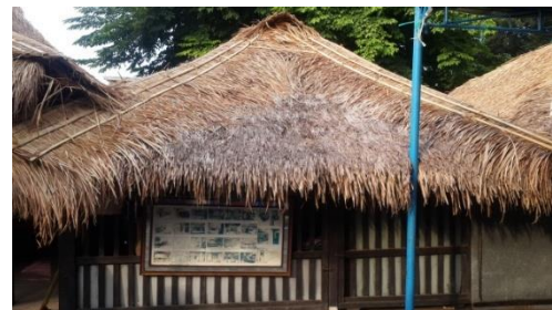
Gambar 4. Pawadonan

Pewadonan memiliki atap sirap dengan tinggi ruang 250 meter dan tinggi bangunan 350 meter. Dinding pewadonan terbuat dari dinding kayu yang dilapisi anyaman bambu (Gambar 4).