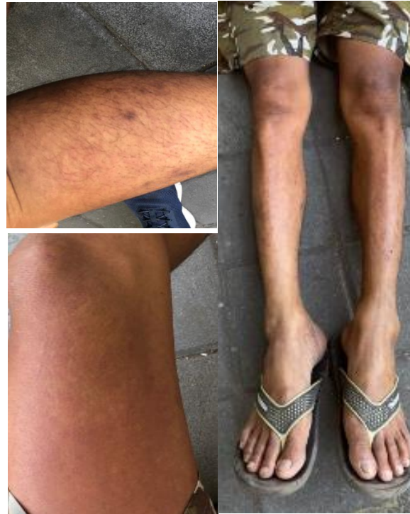
Gambar3. Gambaran ruam kemerahan pada kedua kaki

Hasil pemeriksaan laboratorium didapatkan kadar WBC 6.460 u/L, hemoglobin 13,1 g/dL, trombosit 248.000, BUN 15,3 mg/dL, serum kreatinin 0,7 mg/dL, SGOT 27,2 U/L, SGPT 18,9 U/L, sifilis non-reaktif, anti HbsAg non-reaktif, anti HCV non reaktif, CD4 68 sel/ \mu L dan IgG anti toksoplasma 156,10 IU/mL (Tabel 1). CT Scan kepala menunjukkan adanya gambaran beberapa space occupying lesion di lobus frontal kanan kiri, basal ganglia kiri, hemisfer cerebellum kanan sebagaimana tampak pada Gambar 4.