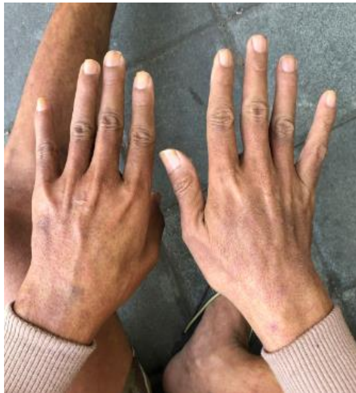
Gambar2. Gambaran ruam kemerahan pada kedua tangan