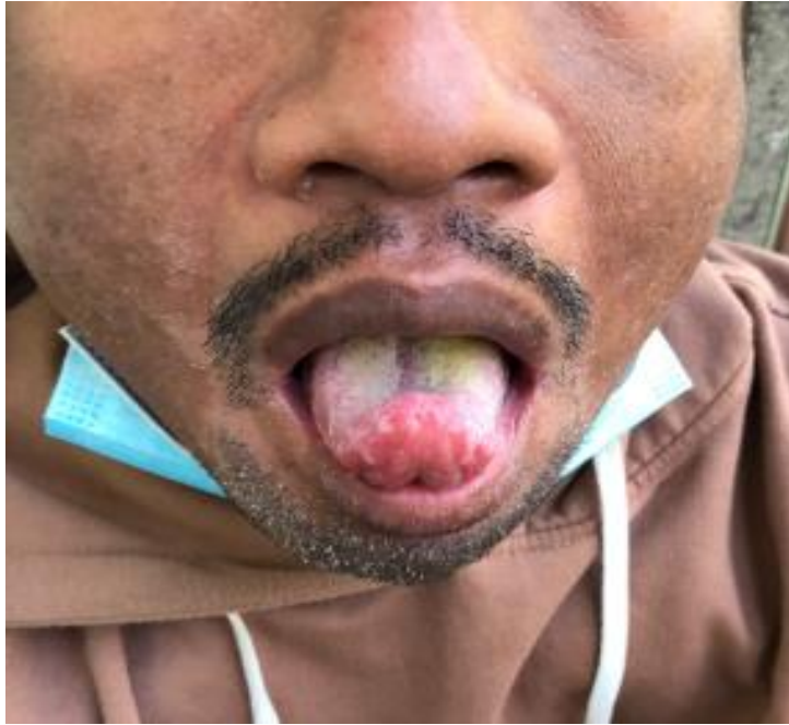
Gambar1. Gambaral oral kandidiasis pada mulut