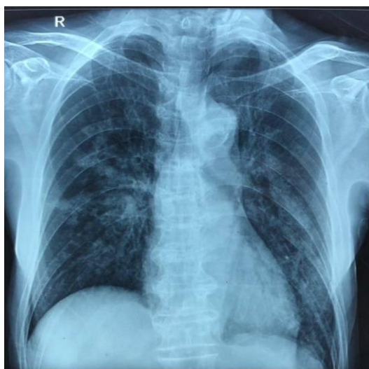
Gambar 3. Foto toraks hari keempat.

Hasil pemeriksaan darah saat masuk didapatkan leukositosis (Tabel 1), dan Neutrophyl Lymphocyte Ratio (NLR) pasien sebesar 6,83. Hasil gula darah sewaktu, ureum kreatinin darah, dan elektrolit normal. Pada hari kedua, profil lipid didapatkan LDL 141 mg/dL. Hari keempat, pasien diperiksa HbA1C. (Tabel 2).