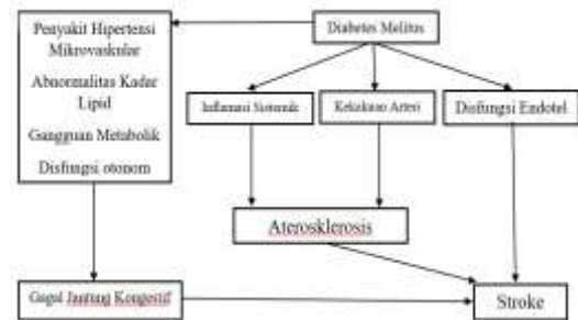
Gambar 1. Mekanisme Stroke pada Pasien dengan Diabetes. [5]

menderita stroke iskemik dan 1.5 kali beresiko menderita stroke hemoragik dibandingkan dengan populasi umum. [4] Permasalahan serebrovaskular yang dapat ditemukan pada pasien diabetes dengan komplikasi stroke antara lain adalah disfungsi endotel vaskular, kekakuan arteri, inflamasi sistemik dan penebalan membran basal kapiler (gambar 1). [5] Disfungsi endotel vaskular dipengaruhi oleh Nitric Oxide (NO) yang memediasi vasodilatasi. Availibilitas NO berkurang pada pasien diabetes sehingga memicu perkembangan aterosklerosis. Availibilitas NO yang terganggu disebabkan oleh inaktivasi NO atau berkurangnya reaktivitas pada otot polos terhadap NO. [5] Pasien DMT2 memiliki kekakuan arteri dan berkurangnya elastisitas sehingga dapat memicu peningkatan tekanan darah yang berkorelasi secara kronis menyebabkan stroke. DMT2 juga memicu inflamasi sistemik yang berperan penting dalam perkembangan plak aterosklerosis. [5] DMT2 juga dapat memengaruhi sawar darah melalui peningkatan permeabilitas sehingga banyak zat yang dapat mekewati BBB dengan penyaringan minimal, seperti albumin yang dapat dinilai melalui albumin quotinent . [6] Dengan meningkatnya permeabilitas BBB dan kejadian mikrovaskular lainnya, pasien DMT2 menjadi sangat rentan terkena stroke dengan berbagai subtipenya yang dapat meningkatkan mortalitas pasien dikemudian hari.